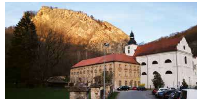
Kostel Narození sv. Jana Křtitele, v pozadí vyhlídková skála nad obcí

značku!, Značkařský kvíz aneb Znáte turistické značky?);