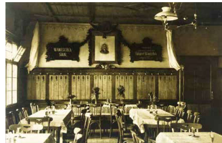
Wanitschek Saal v chatě na Lysé hoře, rok 1915