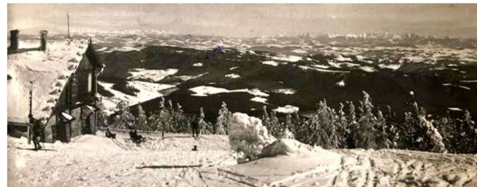
Pohled od Slezského domu k Vysokým Tatrám v roce 1936

turistů na Lysé hoře během dalších let stoupaly. Návštěvníci zde byli uchvázeni zejména úžasnými výhledy na všechny světové strany, nádhernými východy slunce nad Babí horou a západem nad jihozápadním hřebenem Beskyd, ukončeným památným Radhoštěm. Frýdecká sekce BV proto na schůzi dne 8. října 1909 podala návrh na rozšíření chaty. Po jeho schválení došlo k rozšíření na úkor výše zmíněné primitivní stavby z roku 1880, která byla zbourána.