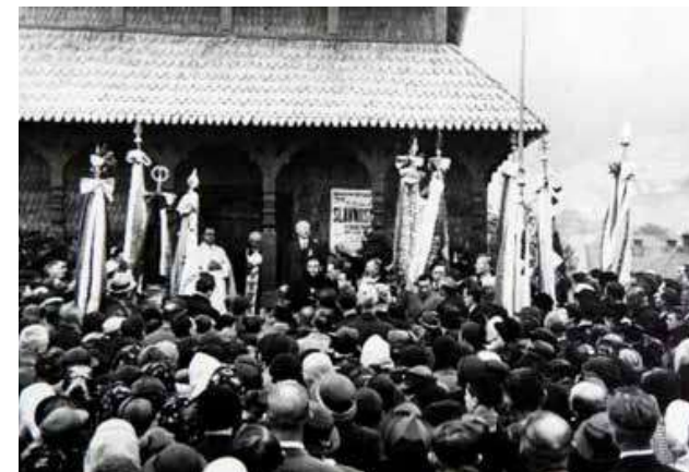
Slavnostní otevření chrámu v neděli 23. května 1937

tak byl dostavěn až v době, kdy obec získala nové obyvatelstvo, tj. v roce 1641. Věřícím pak sloužil úctyhodných 277 let! Při vzniku Československé republiky v roce 1918 byla k novému státu připojena i Podkarpatská Rus. Obyvatelům se začalo lépe dařit a starý dřevěný kostelík jim přestal vyhovovat. Postavili si tedy nový, tentokrát již kamenný, zatímco dřevěný začal pomalu chátrat. Zajímavostí je, že na Ukrajině není dovoleno tyto stavby obnovovat, a proto by tam objekt buď vyhořel, anebo spadl. Na východě ČSR chátral ještě 10 let, než někoho napadlo