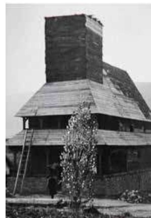
Budování přemístěného kostela v roce 1936

na společenských poměrech, zejména na dostupných financích. Nižné Seliště však tehdy zasáhla morová epidemie, které podlehla celá vesnice. Pravoslavný kostelík