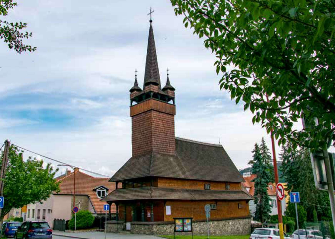
Dřevěný kostel sv. Paraskivy v Blansku