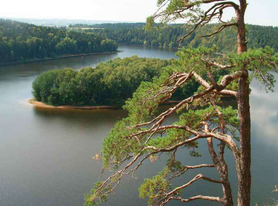
Romantická scenerie údolní nádrže Seč