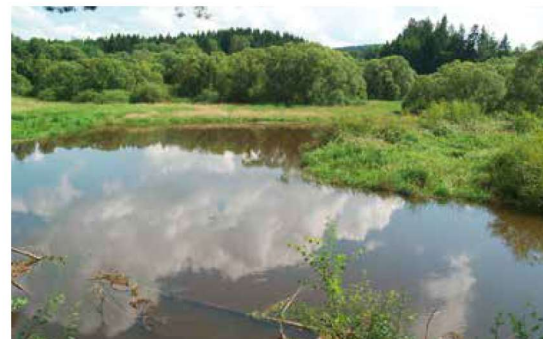
Z údolí Chrudimky pod Klokočovem

Východiskem k dalšímu pokračování putování kolem říčky Chrudimky je město Hlinsko. Za pozornost tu mimo jiné stojí místní část Betlém se skupinou starých roubených domků. Ty jsou už jakousi předzvěstí mnohem rozsáhlejšího souboru lidových