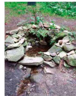
Filipovský pramen Chrudimky