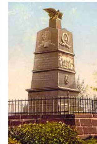
Pohlednice s podobou čtvrtého památníku, který byl odlit ve slévárně v Blansku. Slavnostního odhalení se dočkal roku 1836 a na svém místě vydržel až do rozebrání v roce 1921. Slavíkovičtí pomníku říkali „štátula“ a byl pýchou vesnice