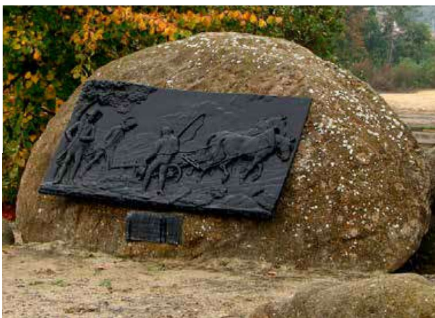
Památník orby Josefa II. ve Slavíkovících u Rousínova