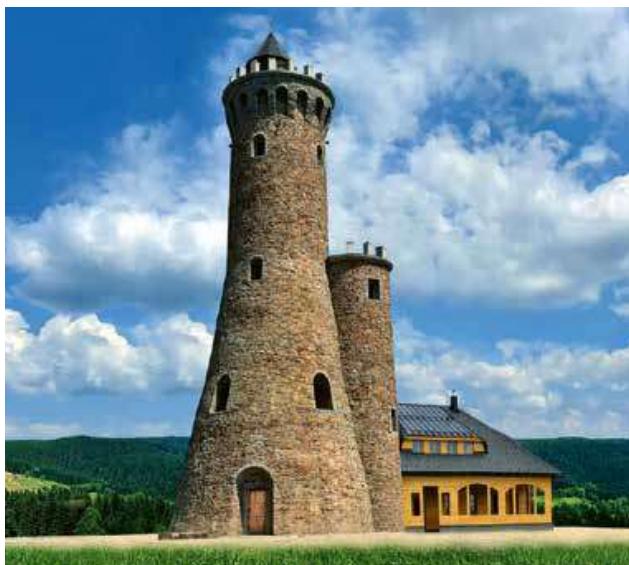
K otevření staronové rozhledny došlo dne 9. července 2021

Unikátní stavba, místo i projekt, ale také poctivé řemeslo a především láska k rodnému kraji – to vše vedlo k tomu, že se v roce 2017 započalo se stavbou Dalimilovy rozhledny na hoře Větrov, věrné repliky původní rozhledny z Králického Sněžníku. Od samého začátku stavbu provázela obrovská podpora nejen místních lidí, ale i Poláků a turistů, kteří do tohoto krásného kraje zavítali a kteří dodávali energii k tomu, aby se přesně po 122 letech od otevření původní rozhledny mohla dne 9. července 2021 představit ve své plné kráse její věrná replika a pokračovatelka odkazu – Dalimilova rozhledna. Původní věž stála v sudetském pohraničí, kde ji pro veřejnost slavnostně otevřeli dne 9. července 1899 za přítomnosti prince Albrechta. Tehdy dostala jméno na počest zemřelého německého císaře Viléma I. Pruského – Kaiser Wilhelm Turm. Stavba podle návrhu architekta Felixe Henryho započala dne 17. července roku 1895, a to díky iniciativě Kladského horského spolku. Jednalo se o impozantní 33 m vysoký objekt, jenž byl výjimečný jak svou velikostí, tak stavebním provedením. Rozhledna poskytovala výhledy nejen na blízké Rychlebské hory a masiv Králického Sněžníku, ale také na vzdálenější hřebeny Hrubého Jeseníku a Orlické hory,