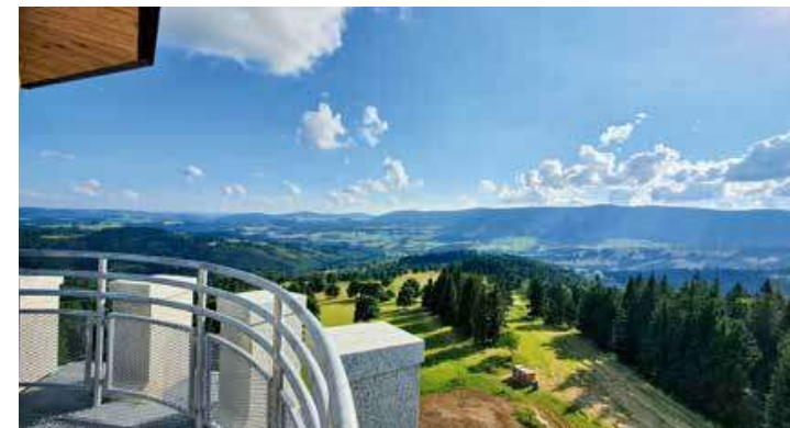
Impozantní výhled z ochozu rozhledny