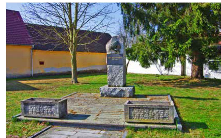
Pomník slavné operní pěvkyně ve Stráži nad Nežárkou

někteří se přidávali a mnohým se v očích zaleskly slzy. V dobách hluboké totality zněl z filmového plátna odkaz, hluboká myšlenka a s přiměřenou dávkou patosu i pocit vlastenectví. Po Emě Destinnové nám zůstal nejen hlasový záznam jejího čistého sopránu, se kterým bravurně zvládla více než 80 velkých operních rolí, ale i silný příběh. V lednu tohoto roku uplynulo 90 let od její smrti, slavnou operní divu si ale připomínáme i bez onoho výročí. Její portrét od Oldřicha Kulhánka je na dvou-tisícové bankovce. Mladá Ema Kittlová vystupuje ve čtvrtém díle pentalogie Vladimíra Neffa o rodech Bornů a Nedabylů Veselá vdova, v televizním seriálu Zlá krev z roku 1986 ji představovala Libuše Šafránková. Množství památek na slavnou pěvkyni dnes schraňuje Národní muzeum; jedná se především o kostýmy, šperky,