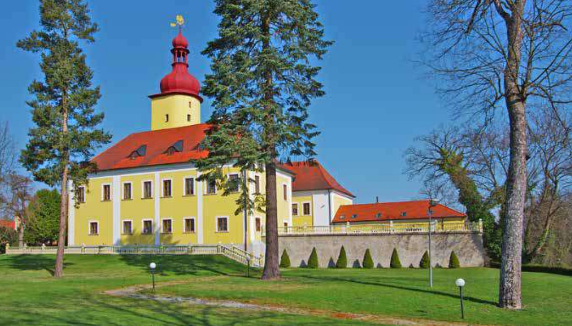
Zámek ve Stráži nad Nežárkou, Ema Destinnová jej získala v roce 1914