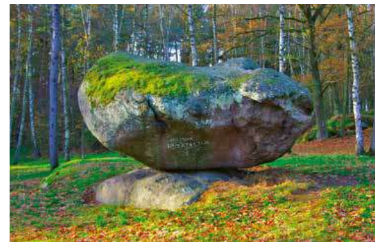
Na viklanu Husova kazatelna prý kázal mistr Jan Hus

(1535–1604) byl regentem rožmberského panství a geniálním stavitelem rybníků. K poddaným se ale choval krutě, na jeho panstvích se ježily šibenice, na nichž dával bez milosti oběsit ty, kteří se mu odvážili protivit. Jak vlastně skončil tento muž plný rozporů? O jeho smrti se moc neví, také nad místem posledního odpočinku se vznášejí nečekané otázky. Jedná se o velikou záhadu, která zůstává dodnes nevyřešena. Je známo, že si Krčín