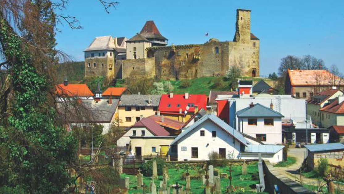
Hrad Lipnice jako výrazná dominanta