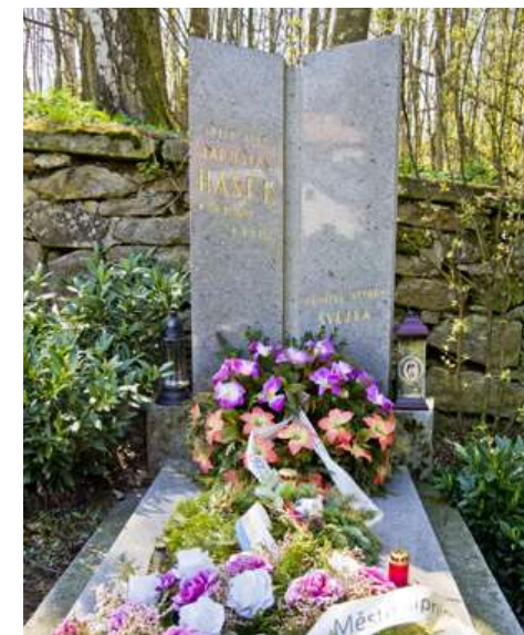
Plastika otevřené knihy na hrobu Jaroslava Haška na lipnickém hřbitově