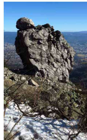
Od skály Krejčík se otevírá pohled směrem ke Krkonoším

Hlavním lákadlem na Ještědu jistě vždy zůstane vrcholová partie, ale za bližší poznání stojí i řada dalších, zejména přírodních zajímavostí. Některé z nich byly vyhlášeny za chráněná území a od roku 1995 jsou též součástí přírodního parku Ještěd. Pro návštěvu zdejších botanicky nebo lesnický nejhodnotnějších partií, například národní přírodní rezervace Karlovské bučiny mezi Karlovem a Kryštofovým Údolím nebo přírodní rezervace Dlouhá hora nad Jitřavským sedlem, je nepochybně nejhodnotnější jarní,