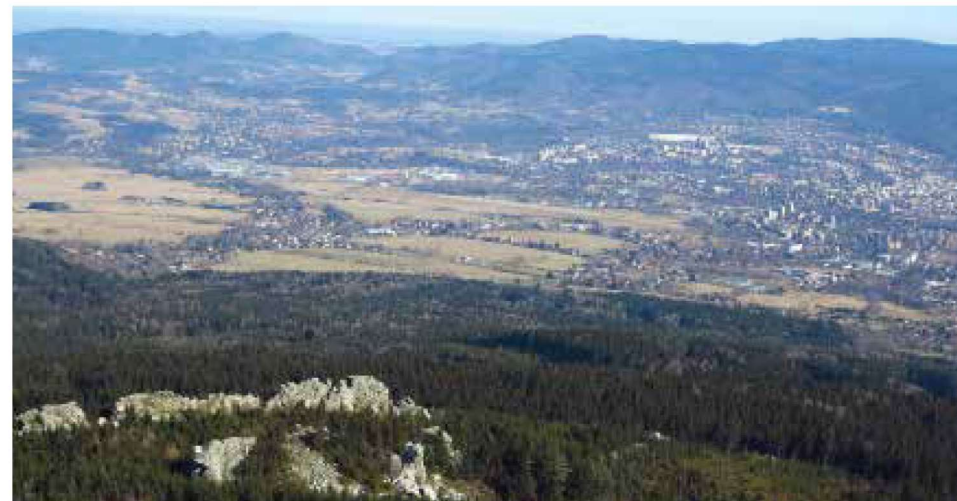
„Letecký“ pohled z Ještědu přes Vířivé kameny na Liberec a Jizerské hory