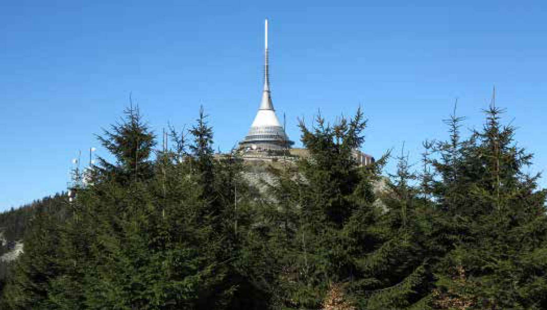
Nezaměnitelná vrcholová partie Ještědu