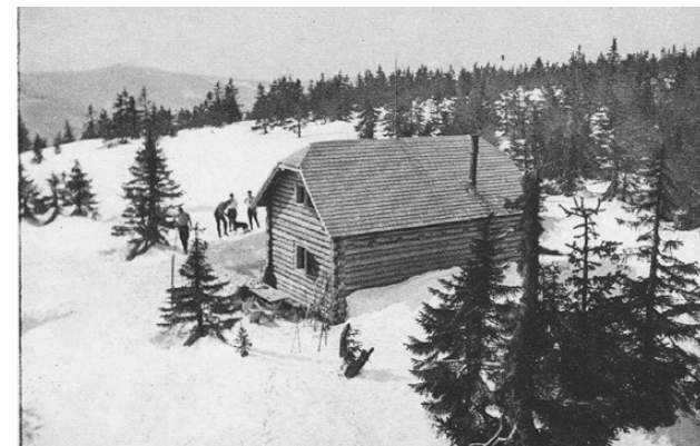
Srubová chata na Svarohu z roku 1922