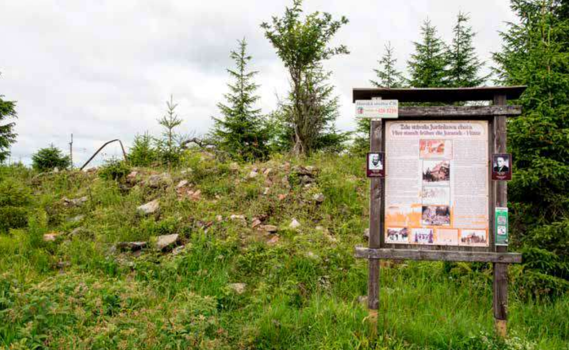
Místo bývalé Juránkovy chaty u vrcholu Svarohu