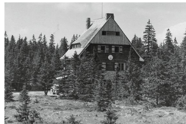
Juránkova chata na Svarohu před 2. světovou válkou

Prášil a přes Roklanskou chalupu až na Březník. V blízkosti chaty se pořádaly lyžařské závody a na nedalekém Velkém Kokrháči stál malý skokanský můstek. V roce 1934 se na svahu pod chatou dokonce konala Velká sjezdová cena Špičáku v alpské kombinaci za účasti 51 závodníků.