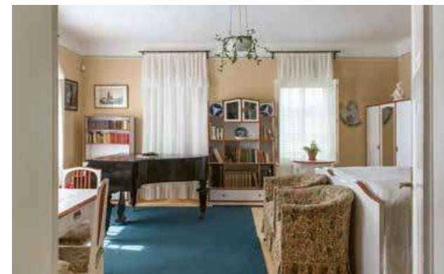
Pohled do někdejší chalupy Vejrychových