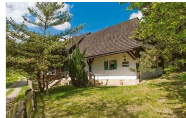
Rodinu Vejrychových i Maxe Švabinského dnes na Kozlově připomíná expozice českořeberského muzea

Švabinský měl široký záběr, v tomto případě méně umělecký. Známé jsou jeho olejomalby Splynutí duší , Chudý kraj , Zně (známé i jako grafika), grafika Rajská sonáta či další grafická díla Josef Mánes a T. G. Masaryk. Mimo to se stal autorem tří bankovek: stokoruny z roku 1931, tisícikoruny z roku 1934 a padesátikoruny z roku 1940. A do výčtu jeho děl patří i některá okna a mozaika v chrámu sv. Víta v areálu Pražského hradu či mozaika v Národním památníku na Vítkově.