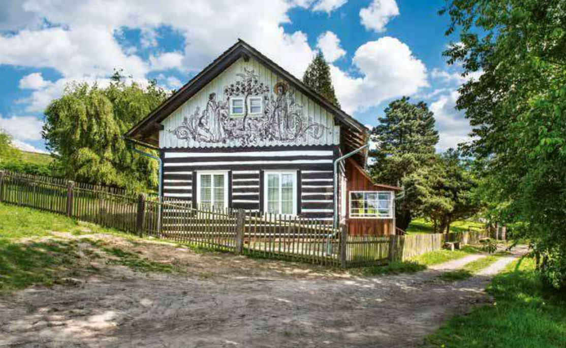
Chaloupka Maxe Švabinského v Kozlově