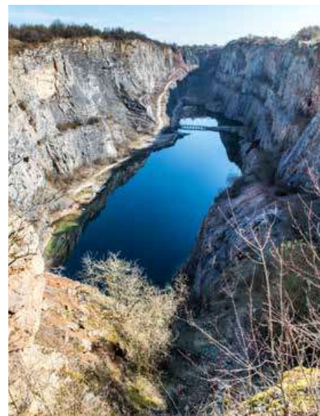
Lom Velká Amerika

Obec Mořina je známá především díky rozsáhlému těžebnímu areálu, kterému kraluje trojice největších lomů na takzvané Americe. Zajímavý je ale také název obce, jenž vždy přitahoval pozornost jazykovědců. Ti odvozovali pojmenování Mořiny od slova mora,