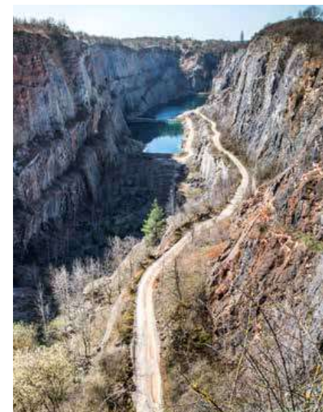
Velká Amerika z vyhlídky