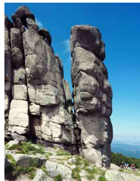
Zkamenělý dábel je součástí žulového skaliska Polední kámen.

Dávná kamenná lavička i žulové plotny u Poledního kamene – Stoneczniku lákají ke krátkému odpočinku i dalekým výhledům a „hřebenová“ Cesta přátelství zde zdaleka nekončí. Horskou túru