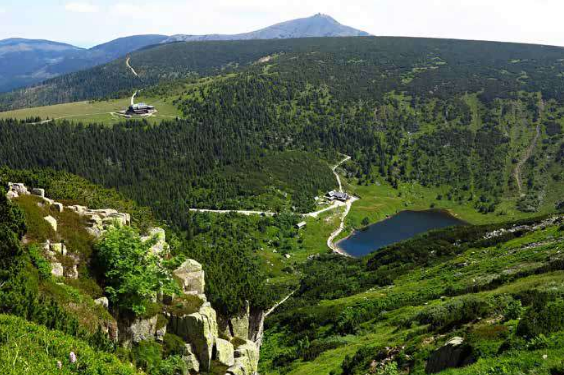
Pohled ze Stříbrného hřbetu přes Stříbrné věžičky do jámy Malého Stawu a ke Sněžce.