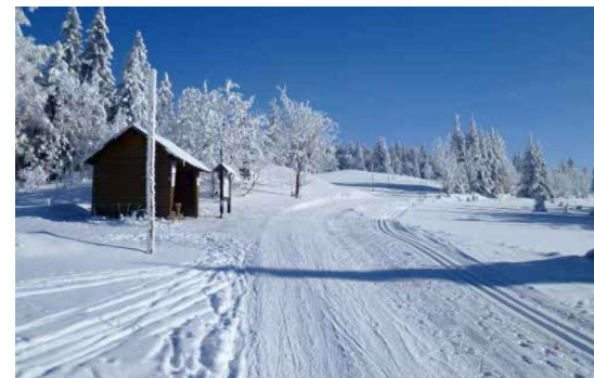
Lyžařské stopy jsou krásně upraveny a nechybí ani odpočívadla

denní etapovou jízdu „Lyžařského přejezdu Krušných hor“ z Kraslic do Chomutova. Podle zvoleného směru a odboček ujedeme každý den 35 až 40 kilometrů, po kterých nám vždy zbudou síly i na večerní posezení s přáteli. Nemusíme tedy být žádní olympionici, aby nám Krušné hory poodhalily své krásy a tajemství. A možná potkáme i Marcebilu, patronku Krušných hor. Tak si připravte k vyprávění i své příběhy ze života, pro setkání s ní i pro večerní posezení se budou hodit.