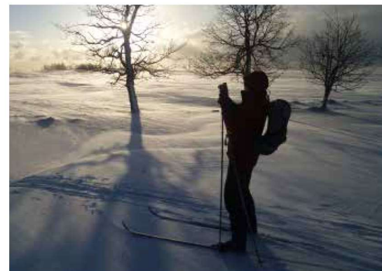
Odjezd z Měděnce při východu slunce

Z rozcestí za Předním Ostružníkem jsme se ovšem dost vezli z kopce a zima, co leze pod bundy, nás popohání po silničky do kopečka k rozcestí turistických tras „Rolava – bývalá obec“. Nespornou výhodou je, že tato