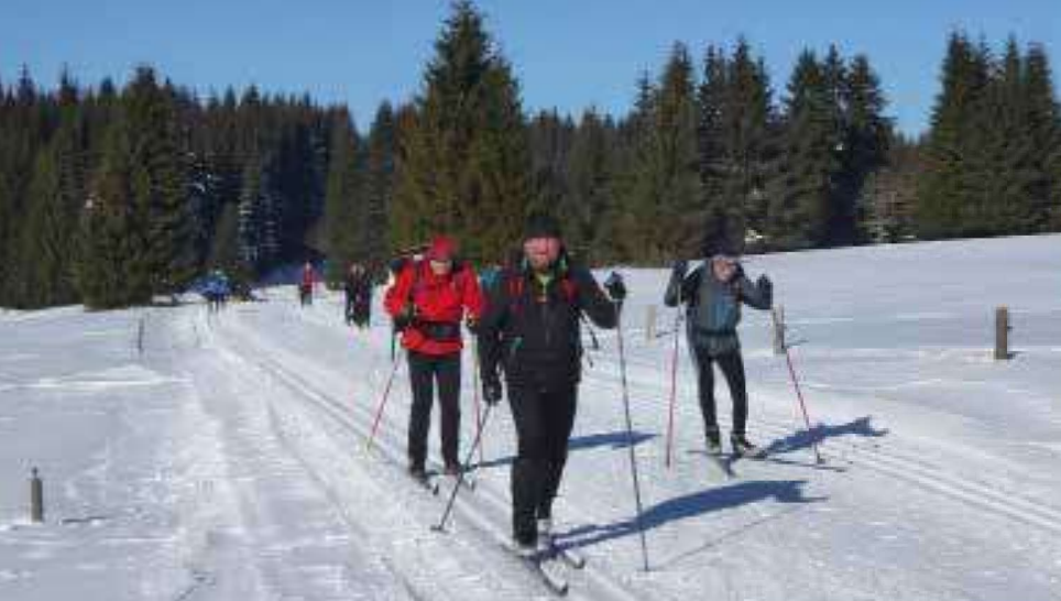
Krušnohorská lyžařská magistrála je pro běžkaře ideální