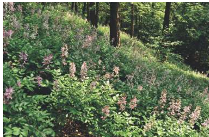
Stráň pokrytá třemdavou bílou

S přicházejícím létem většina rostlin napne veškeré síly ke tvorbě plodů, a spokojí se tak s odstíny zelené, ale právě díky tomu a s o to větší pompou dají vyniknout statné třemdavě bílé. Ta se rozhodně nesměle nekrčí kdesi v podrostu, ale ztepíle ční do výšky až jednoho metru a vystavuje svá bohatá růžová květenství. Ovšem i zde je potřeba mít se na pozoru, jelikož si