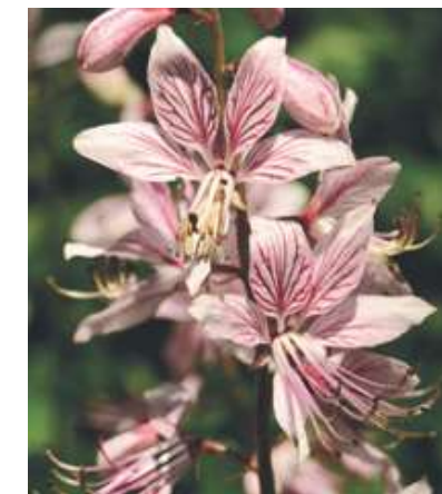
Třemdava bílá, známá také pod lidovým označením „hořící keř“