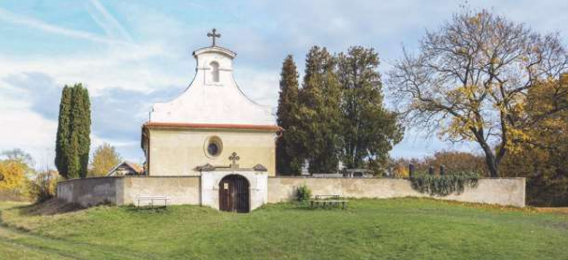
Hradiště Libušín s kostelem sv. Jiří