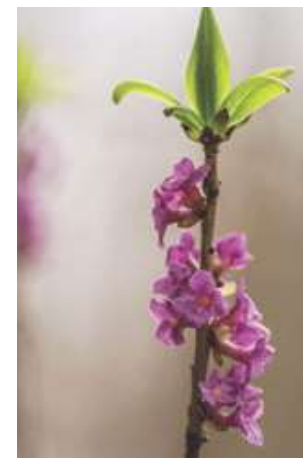
Před lýkocem jedovatým je třeba se mít na pozoru

Malebná i nebezpečná flóra Krása kamene neohromí každého,