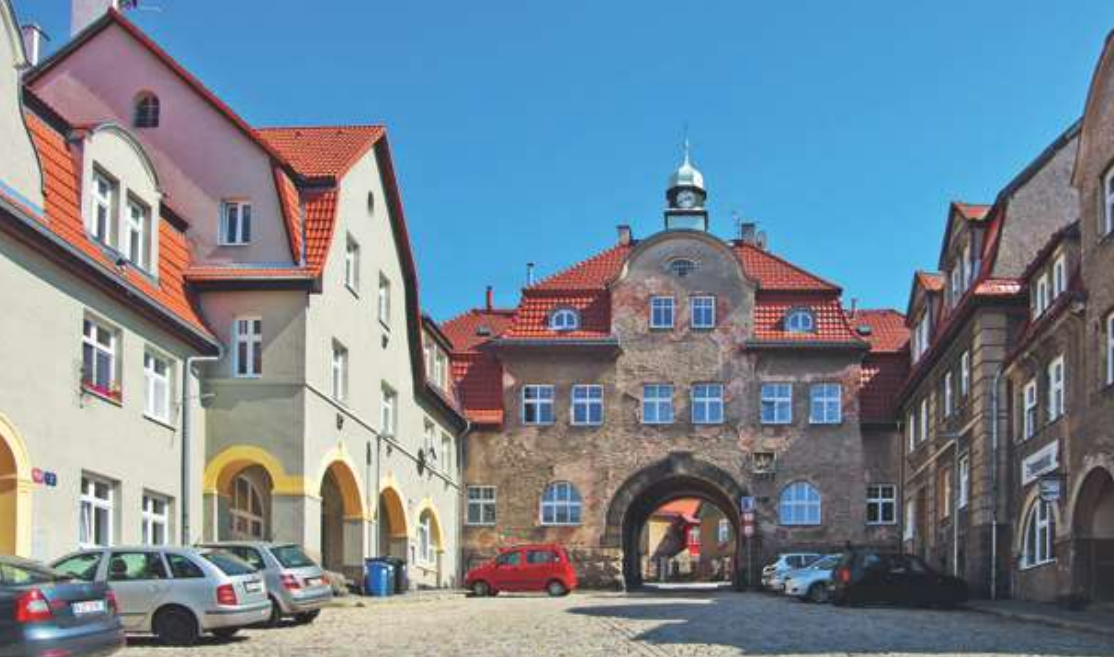
Libiegovovo městečko - náměstí Pod Branou