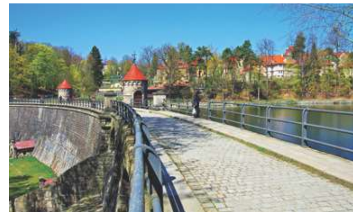
Harcovská přehrada vznikla v prvním desetiletí 20. století

Po Johannově smrti se v Liberci vystřídaly další generace Liebiegů, které po sobě zanechaly výraznou stopu. Za jejich finanční pomoci byla vybudována liberecká radnice, Harcovská přehrada, sami postavili řadu objektů (vede k nim prohlídkový okruh Po stopách Liebiegů a jednotlivé stavby jsou opatřeny tabulkami s informacemi). K neúspěšnějším a nejbohatším podnikatelům své