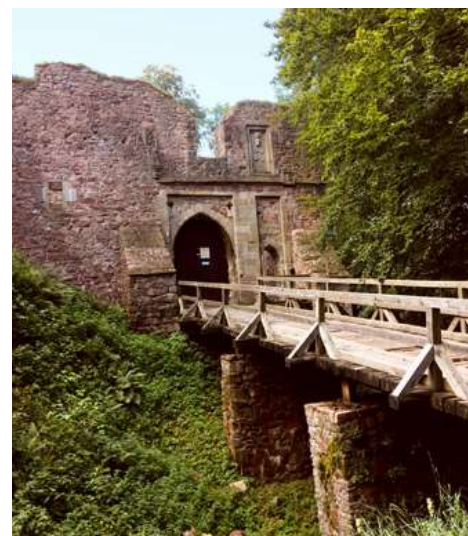
Vstup do hradu Litice nad Orlicí

dostaneme modrou TZT. Od rozcestníku Potštejn-pod hradem vede souběžně Křížová cesta, vycházející od kostela sv. Vavřince. Na místě hradu stávalo v pravěku hradiště. Samotný hrad byl vystavěn Půtou z Potštejna z rodu západočeských Drslaviců na konci 13. stol. V roce 1312 vlastnil hrad Procek z Potštejna a následně jeho syn Mikuláš. Mikuláš z Potštejna patřil k největším odpůrcům Lucemburků. Pro neshody s Janem Lucemburským se stává loupeživým rytířem. Tehdy nedobytný hrad dobyl během 9 týdnů v roce 1339 budoucí český král Karel IV. Mikuláš z Potštejna zemřel pod strženou věží. Potštejnské panství kupuje v 18.stol. rod Harbuval Chamaré, v tomto období zde vznikají nové sakrální stavby, např. kaple Svatých schodů, dnes zasvěcena sv. Janu Nepomuckému, a Křížová cesta. Zároveň dochází k marnému hledání Potštejnského pokladu Janem Antonínem Harbuval Chamaré