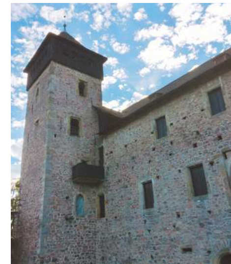
Hrad Litice nad Orlicí - věž