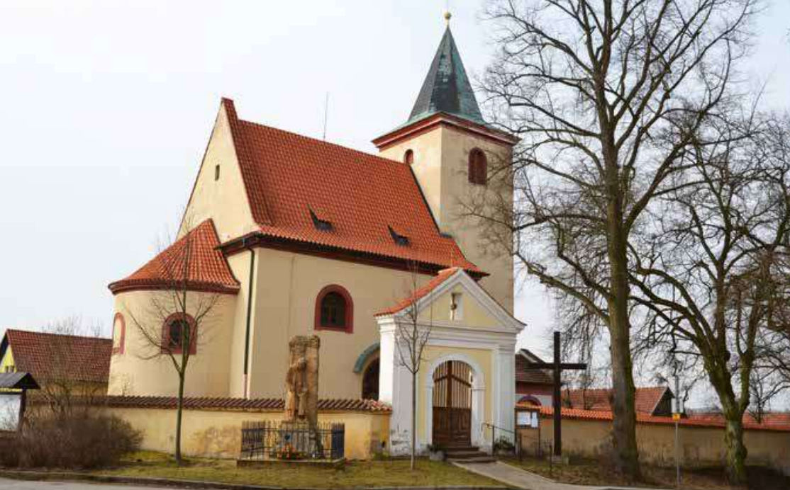
Hrusický románský kostel sv. Václava