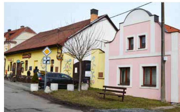
Některé domy v Hrusicích mají stále „ladovskou“ podobu