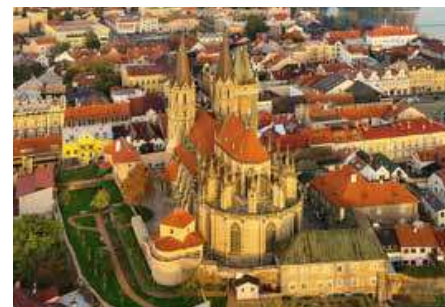
Bartolomějské návrší v Kolíně se může pochlubit hned několika unikáty