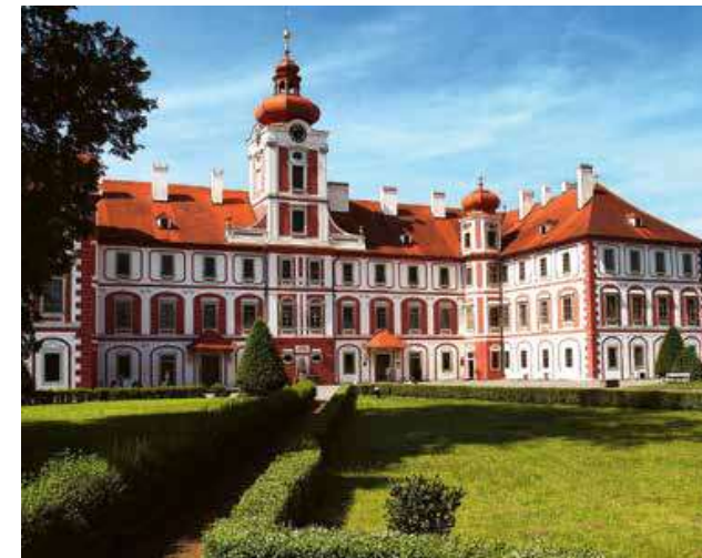
Barokní klenot - zámek v Mnichově Hradišti

Pokud disponujeme větší časovou rezervou, stojí za prohlídku i poněkud méně známá kamenná hříčka – přírodní památka Káčov. Je součástí zalesněného návrší zvedajícího se přímo nad obcí Sychrov, kam z Mnichova Hradiště vede zelená turistická značená trasa (TZT) nebo silnice přes obec Podolí. Po stezce opatřené schůdky vystoupíme k bizarnímu skalnímu „pahýlu“, což je asi 20 m vysoký sopečný komín z třetihorní čedičové vyvřeliny. Informační tabulka nás poučí, že žhavá láva zde při výstupu přetavila okolní vrstvy pískovců v horninu zvanou káčovák, vhodnou zejména pro vodní stavby, a proto kdysi těženou pro zřizování říčních jezů a rybníč-