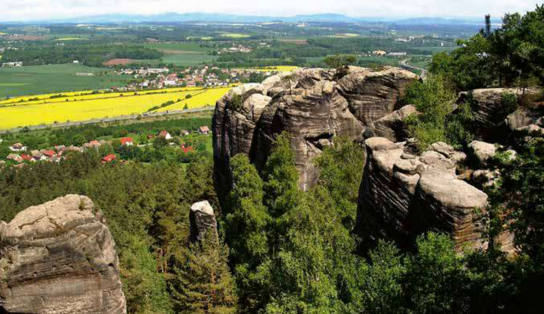
Členité okraje Příhrazské plošiny jsou místem dalekých výhledů