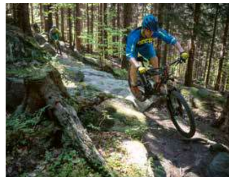
V anketě 7 divů Olomouckého kraje zvítězily Rychlebské stezky, navštívte je na kole i vy