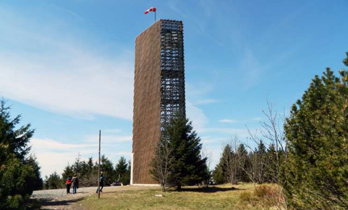
Nová rozhledna na Velké Deštné