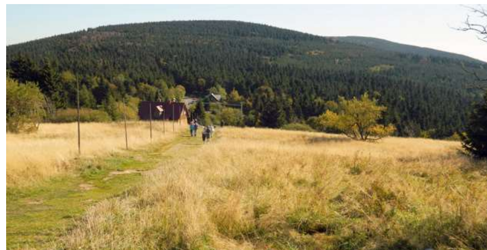
Malá a Velká Deštná

trvale obývané osady, v níž jsou dnes už jen chalupáři. Pokud jsme zdatnými chodci a chceme vidět něco netradičního, můžeme se vydat směrem ke Zdobnici. Ze silnice pak odbočíme na lesní cesty, po nichž můžeme dojít až k zajímavému a tajuplnému přírodnímu útvaru zvanému Sfinga. Sedm metrů vysoká skála skutečně svým tvarem onu bájnou egyptskou Sfinxu připomíná. Je to zvláštní místo příhodné zejména k tichému