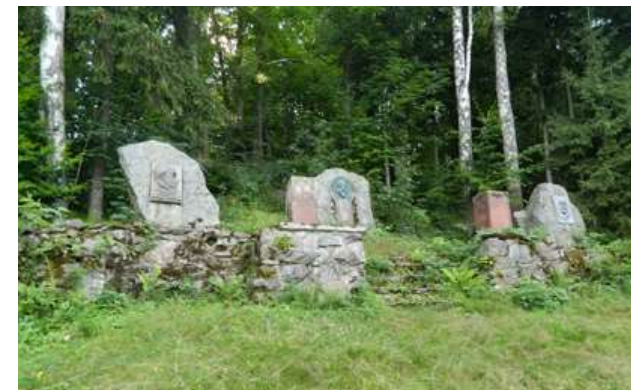
Slavin Orlických hor