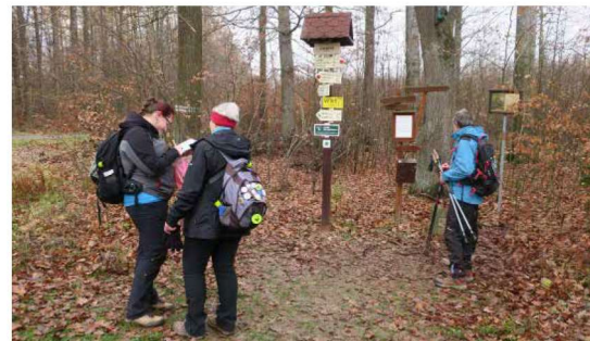
U Slepice, nejvyšší vrchol Ždánického lesa

Naše cesta dále vedla na vrchol U Slepice. Jedná se sice o nejvyšší vrchol Ždánického lesa, při jeho zdolávání jsme se však příliš nezapotili. Se svými 437 m je totiž kopec jedním z nejnižších položených nejvyšších vrcholů u nás. Na roz-