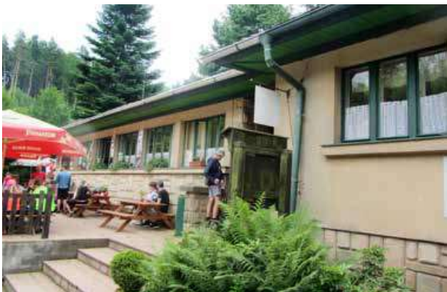
Pavilon v Prachově v červenci 2021

Jak jsme již v našem seriálu o chatách KČT napsali dříve, Prachovské skály se staly nejen u nás, ale i v zahraničí – díky výborné propagaci, kterou prováděl již před 1. světovou válkou O-KČT Jičín a po něm Spolek turistů Jičín – velmi známé. České děti se o Prachovských skalách učily již v obecné škole, různé korporace pořádaly do skal zájezdy, zlepšilo se vlakové, později i autobusové spojení. Ústředí KČST neváhalo využívat Prachovské skály jako výkladní skříň české turistiky. Pražská centrála zde pořádala akce pro zahraniční turisty, přičemž nejvýznamnější z nich se stal 1. sjezd Asociace slovanských turistických družstev v roce 1926 (tato asociace byla z iniciativy KČST založena o rok dříve ve Vysokých Tatrách). Jak stoupala návštěvnost, vzrůstaly samozřejmě i příjmy klubu, místních obcí i nedalekého města Jičín, což umožňovalo další investice v této oblasti. KČST tak