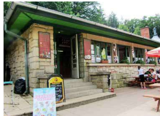
Detail vstupu do pavilonu – zdívko je typické pro tzv. prachovskou architekturu