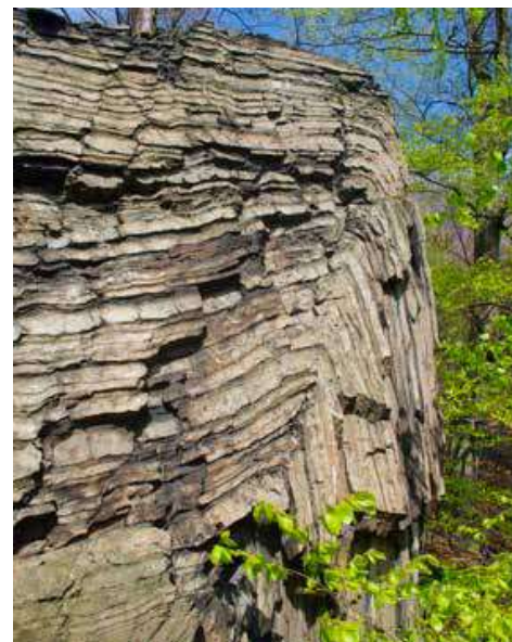
Vrásá v Oderských vrších

kulturní akce. Viditelný je z trasy turistické stezky, která směřuje na jihozápad do sousední Luboměře a pak se napojuje na modrou TZT do Potštátu. Nejhezčí větrný mlýn ovšem zkrášluje krajinu Oderských vrchů v Partutovicích, kterým se modře značená stezka