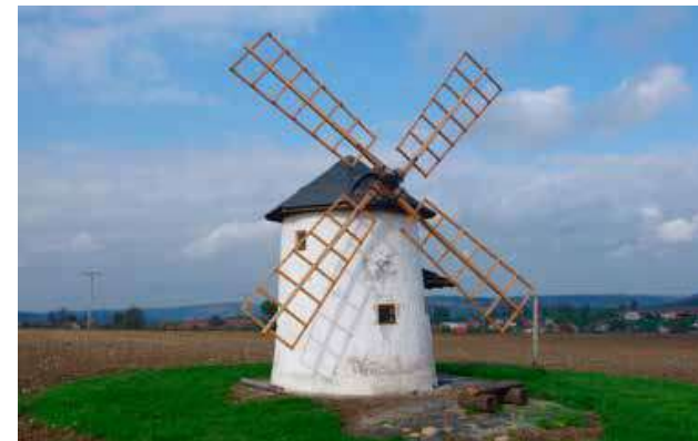
Větrný mlýn u Spálova

Zelené turistické značky nás dále vedou příkrým výstupem na náhorní pláň, kde se v mělkém úvalu rozkládá městyš Spálov. Na rozdíl od okolních převážně německých obcí tu mělo v minulosti výrazné zastoupení česky mluvící etnikum, které nebylo vysídleno ani po záboru Sudet v roce 1938, ani po roce 1945, kdy se Oderské vrchy odsunem Němců vylidnily. Spálov je ovšem pozoruhodný ještě něčím jiným. Historické listiny zde dokládají existenci celkem sedmi větrných mlýnů, přičemž pět z nich mlelo v roce 1875 současně. A ten jediný, jenž se zachoval do dnešních dní, je záro-