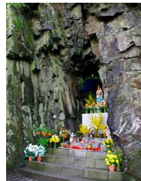
Mariaskála, někdy označovaná také jako Panna Maria ve skále