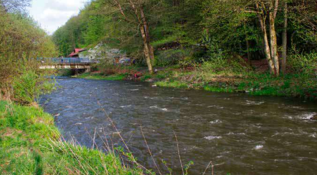
Řeka Odra u Mariaskály