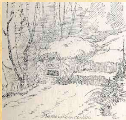
Turistická značka s monogramem KČT

Jakmile řečník na přednášce seznámil posluchače se značkařským vybavením, byla pozornost věnována samotným značkařům a nově vyznačeným trasám. Obě tyto zajímavé kapitoly si však necháme až do příštího čísla.