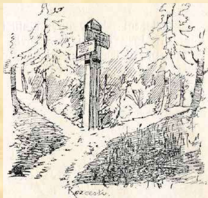
Vzorově vyznačená křižovatka