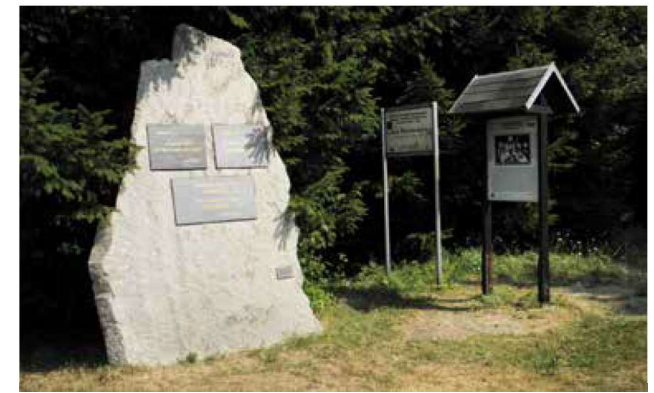
Pomník schůzek odpůrců komunistického režimu na Borůvkové hoře

že Sudety jsou především místo, kde lidé od pradávna žili, žijí a žít budou. Cíl stezky představuje jediná stavba, která zůstala stát z někdejší osady Jedlovec, kdysi šišky, zmíněného už k roku 1787. Kaple sv. Anny stojí na místě, kolem nějž chodili horníci za prací do dolů v okolí dnešního Zlotoho