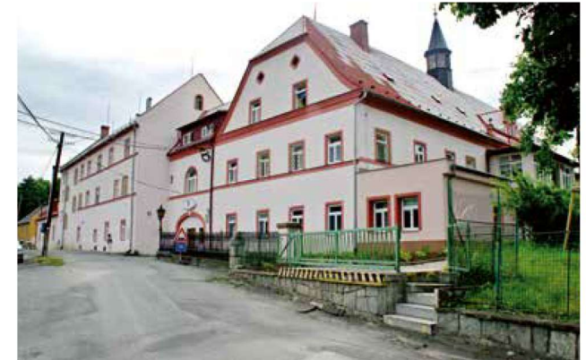
Psychiatrická nemocnice Marianny Oranžské je v jejím někdejší sídle v Bílé Vodě