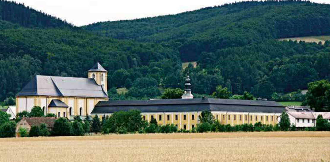
Barokní areál piaristické koleje v Bílé Vodě při pohledu z Polska