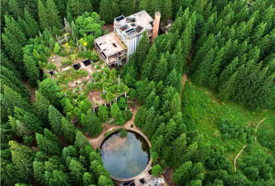
Pohled na továrnu shora