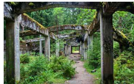
Bývalý sklad cínového koncentrátu