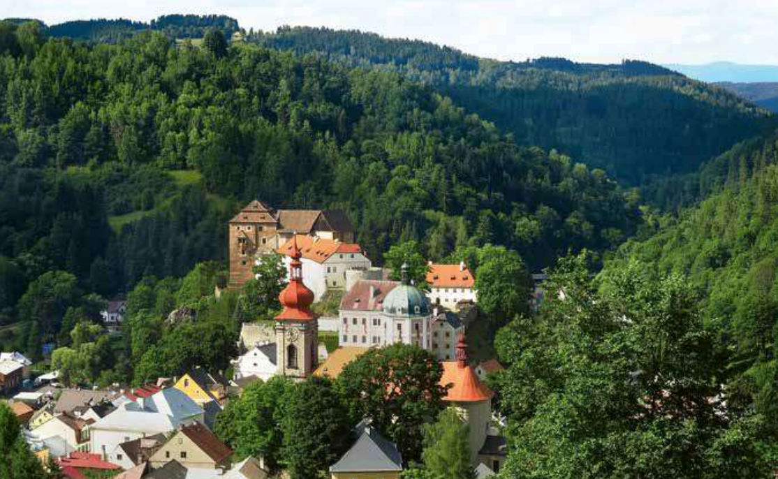
Nejhezčí pohled na historickou část Bečova nad Teplou je ze Zlatého vrchu.