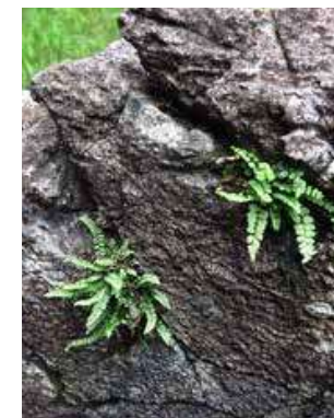
Tato kapradinka sleziník roste jen na hadcích.