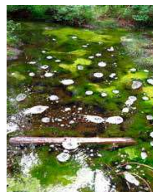
Výrony plynu (mofety) v přírodní rezervaci Smradoch.