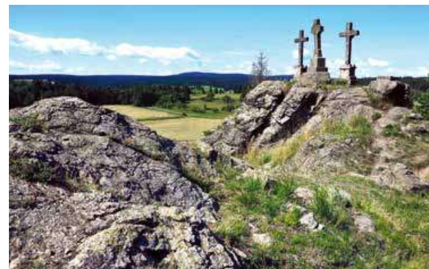
Působivá „hadcová scenérie“ Tří křížky patří k symbolům Slavkovského lesa.

Na první „hadcovou“ lokalitu při zelené narazíme hned na začátku naučné stezky. Zdejší přírodní památka Dominova skalka dostala pojmenování podle významného českého botanika a znalce místní květeny Karla Domina (1882-1953). I zde se daří zejména „hadcomilným“ rostlinám, včetně některých druhů kapradin (např. sleziníků). V blízkosti naučné stezky se můžeme osvěžit i chutnou vodou z podchycených pramenů (Grünská a Novoveská kysečka), zdejší vrt je jedním ze zdrojů známé minerálky Magnesie. Podmanivým místem je pak skupinka dalších hadcových skal, zvaná Tří křížky a chráněná v národní přírodní památce Křížky. Vystupuje z náhorní planiny Slavkovského lesa a největší skalku zvyrazňuje trojice křížů, umístěná sem v polovině 19. století, snad jako projev vděku za uzdravení