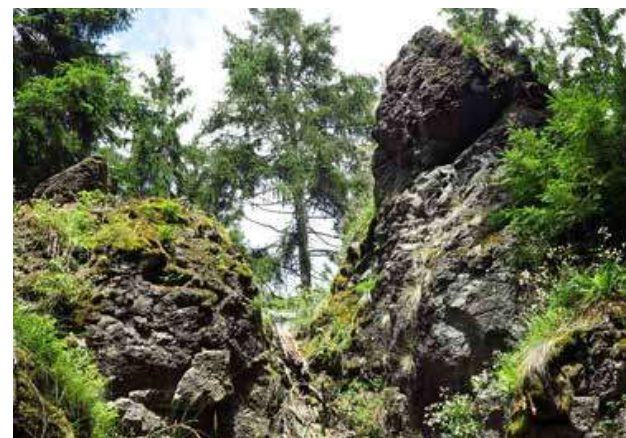
Hadcové věže a bloky tvoří na Vlčku malé skalní město.