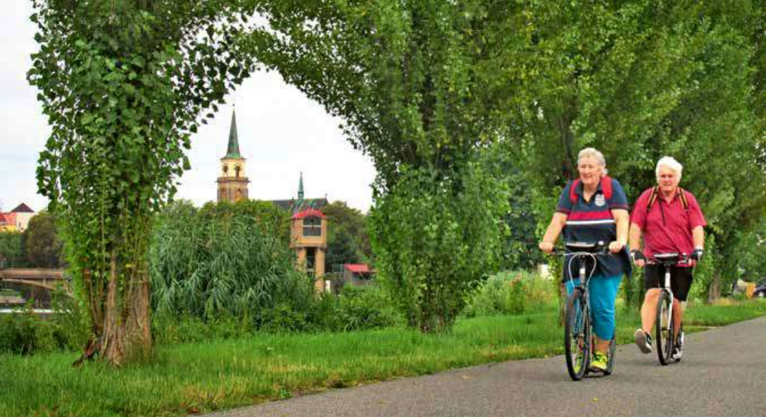
Cyklostezku podél Labe mezi městy Nymburk a Poděbrady využívají nejen pěší a cykloturisté - v pozadí nymburský kostel sv. Jiljí