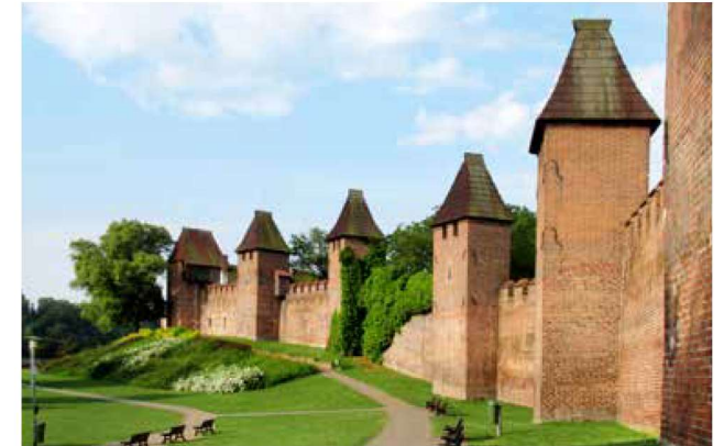
Městské hradby jsou pýchou města Nymburka

přístavu, za kterou sem proudí tuzezemští i zahraniční turisté. Součástí této siluety je bílou omítkou svítící nevelké stavení Staré rybárny, nyní nabízející občerstvení. K té se váže příběh příjezdu Elišky Přemyslovny