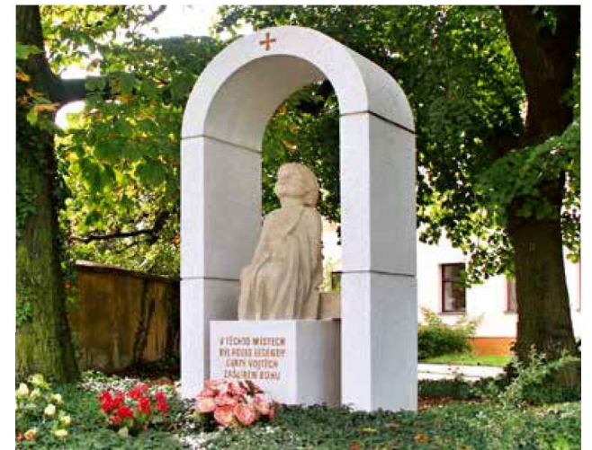
Socha Vojtíška v Libici nad Cidlinou

do Nymburka v květnu 1310, kdy rybářka jí i její průvod převázela přes řeku. Tehdy se před úklady svého švagra Jindřicha Korutanského skryla Eliška v Nymburce, kde byla věře přijata měšťany i sousedy.