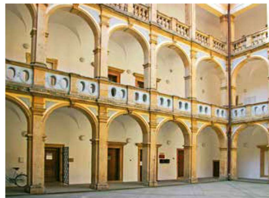
Nádvoří jičínského zámku

V kritický den dorazila do Jičína královská komise doprovázená Jindřichem Slavatou a bez otálení se pustila do sepisování majetku, který je třeba vrátit. Paní Eliška úpěnlivě prosila, křičela, vyhrožovala, plakala – vše samozřejmě marně. A tak se svými vojáky sešla do prachárny ve sklepení, aby jim podle starého zvyku sama rozdělila střelný prach. Za chvíli se však ozval obrovský výbuch a polovina zámku, v níž právě panstvo pobývalo,