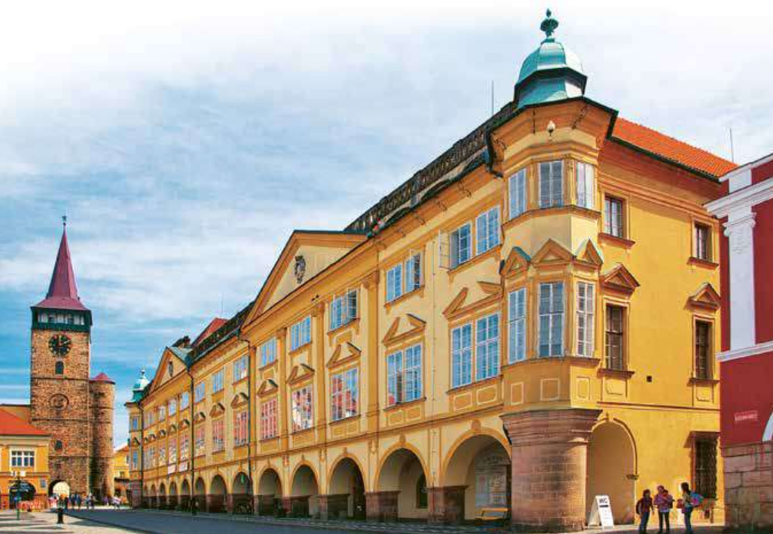
Valdštejnský zámek a Valdická brána v Jičíně