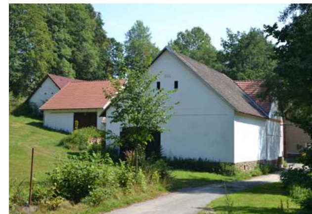
Micáskův mlýn v Modlíkově

Začneme v místě, kde tento vodní tok vzniká spojením Nadějkovského a Jistebnického potoka. Kousek pod soutokem najdeme malou osadu Modlíkov a nedaleko odtud pověstný mlýn Micáskov. Pozoruhodné názvy – a ještě podivnější pověsti! Vypráví se, že zdejší lakotná mlynářka uzavřela smlouvu s ďáblem. Když přišla chvíle zúčtování, nechťelo se jí samozřejmě do pekla, a tak si dala podmínku, že čert musí do prvního kohoutího kokrhání přinést kámen z jeruzalémského chrámu. Pekelníkovi se to málem podařilo, jenže mlynářka mu v poslední chvíli hodila pod nohy posvěcený růženec, ďábel zakopl a padl s kamenem tak prudce, až si do něj otiskl celá záda – a navíc tím hřmotem vzbudil všechny kohouty v okolí. Nezbylo mu než v sirném dýmu opět zmizet do pekla. Onen kámen dodnes leží ve svahu nad silnicí a připomíná několik na sebe položených pecnů chleba. Neblahé místo je však vyváženo žehnačím silou Panny Marie. Jen malý kousek od Čertova kamene totiž spatříme ve zbytku opuštěného