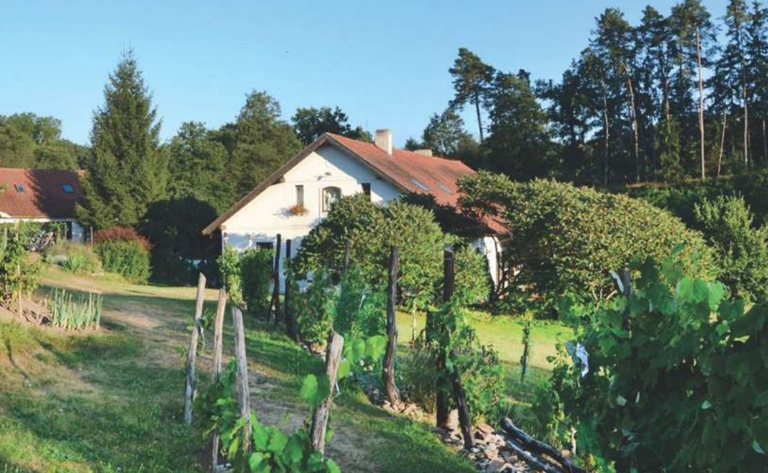
Půvabný mlýn Na Prádle, dnes slouží jako penzion