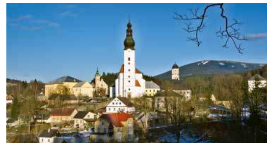
Kouzelný pohled na centrum Branné z cesty do Starého Města

okrajem náměstí a svými nejvyššími vrcholy sahá do nadmořské výšky téměř 800 metrů. Právě přes nejvyšší vrchol vede červenou značkou provázená cesta, mířící do horského střediska Petříkov. Brzy narazí na řadu řopíků a opevnění. Není bez zajímavosti, že právě zde, na úbočí hory Jelen (799 m) a Kutného vrchu (798 m), byly objeveny stopy zřejmě nejstaršího dolování rud na Staroměstsku.