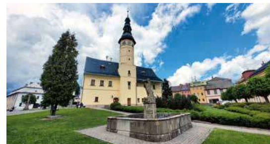
Renesanční radnici ve Starém Městě pod Sněžníkem podle legendy měla stavět paní Eliška Petřvaldská. Ve skutečnosti to ale bylo asi jinak.

I když se kromě Králického Sněžníku nabízí třeba i cesta přes rozhlednu na Větrově k chatě Paprsek a do Rychlebských hor, za trochu námahy rozhodně stojí i výlet do Hanušovické vrchoviny. Ta se začíná zvedat hned nad východním