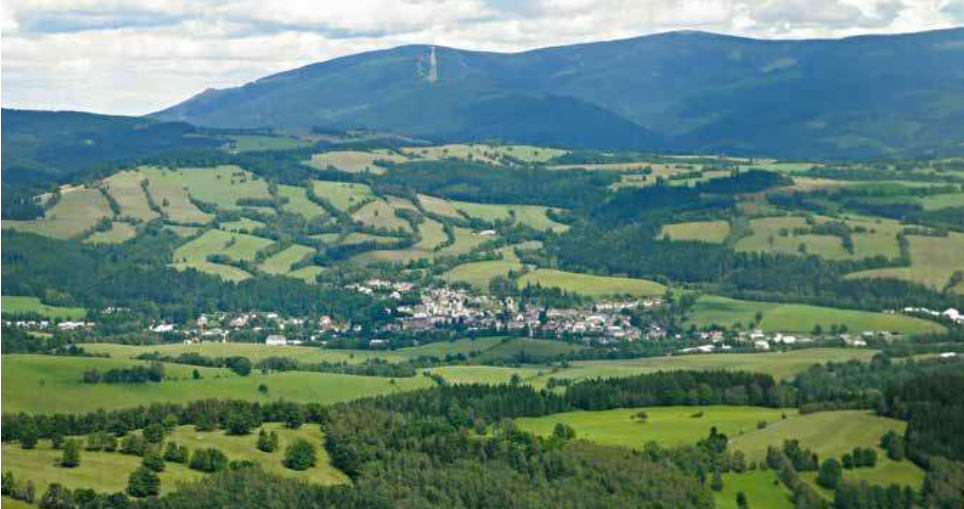
Staroměstská kotlina v pozadí s náhorní plošinou Hanušovické vrchoviny a za ní jesenícké hory Šerák a Keprník