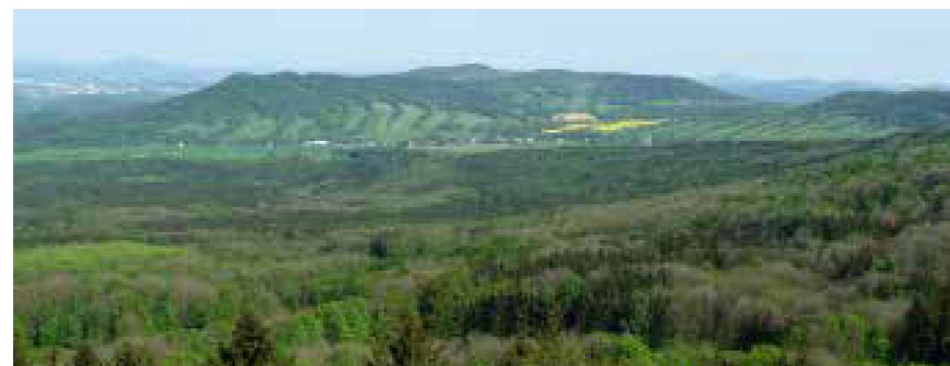
Pohled z rozhledny na Strážném vrchu na kopec Kozel, vzadu nalevo je Česká Lípa a za ní Ralsko

na Strážném vrchu byly postupně zbudovány dvě rozhledny. Starší, kamenná, 10 m vysoká, společně s malou restaurací a kuželníkem, kde se prý i tancovalo, stávala na vrcholku od roku 1925. V roce 1963 však byla již značně poškozená a zřítíla se (patrně při bouři). Od té doby vrcholek Strážného vrchu, tvořený balvany a kamennou sutí, postupně zarostl neprostupnými křovinami, a přístup k troskám bývalé rozhledny byl tak velmi obtížný. A protože byl vrch ještě v nedávné době téměř úplně pustý a chodil na něj jen málokdo, působil velmi tajemně a divoce. V roce 2006 však obec Merboltice nechala na Strážném vrchu postavit novou rozhlednu. A když dnes na novou, dřevěnou