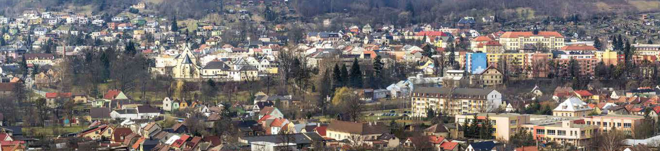
Město Odrá - panorama z kopce Pohoř