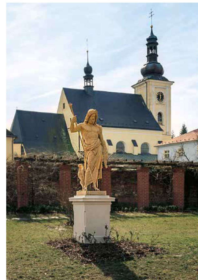
Socha Jupitera v zámeckém parku, v pozadí kostel sv. Bartoloměje

Z náměstí Odrá k prvnímu zastavení NS „U Spurného“ je to 1,5 km daleko. Jdeme okolo kostela sv. Bartoloměje, staré hasičské zbrojnice, dále procházíme zámeckým parkem, až dojdeme k mostu přes řeku Odru. Za mostem pak pokračujeme kousek po ulici Skřivánčí, kde se napojíme na červenou a modrou turistickou značenou trasu (TZT). O kousek dále se u rozcestníku „Odrá, Nové sady“ s červenou rozloučíme a po modré TZT dojdeme k začátku NS „U Spurného“. Z tohoto místa je to po modré TZT a značení NS k rozhledně Olšová 4,5 km. Nejprve mírně stoupáme k výletnímu