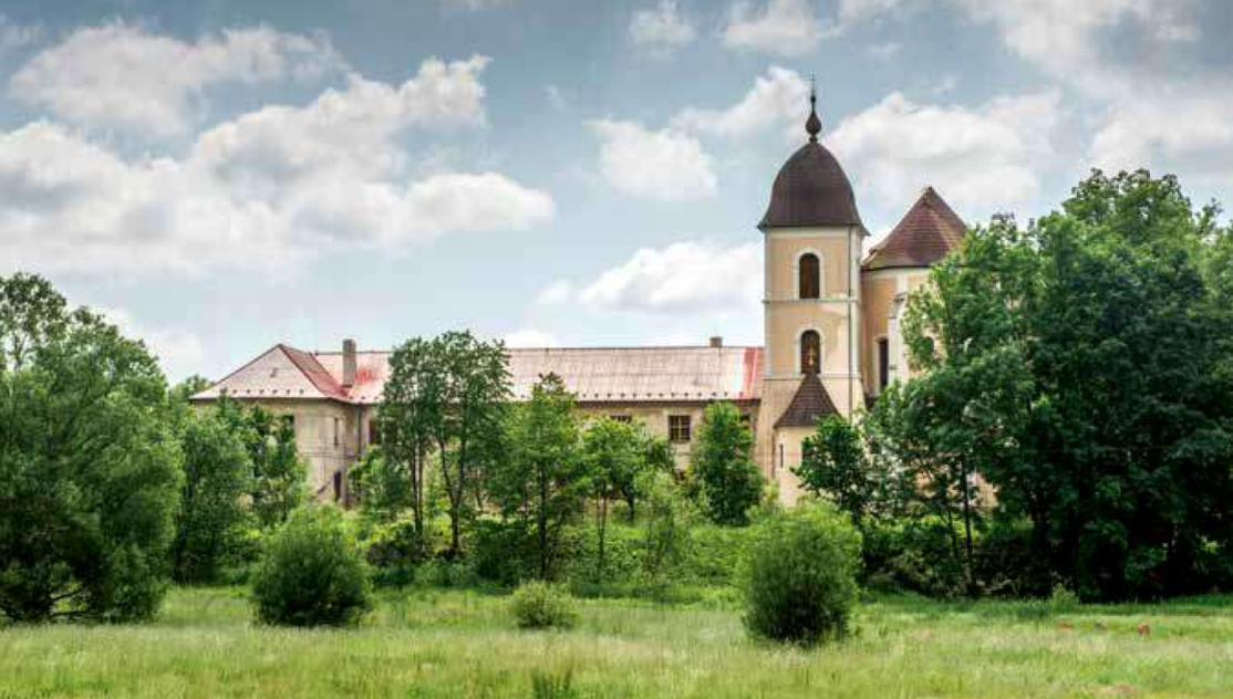
Kláster augustiniánů Svatá Dobrotivá v obci Zaječov