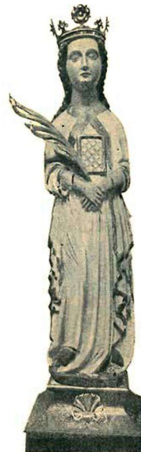
Původní socha sv. Dobrotivé měla v hrudi vydlabanou schránku k uložení relikvií