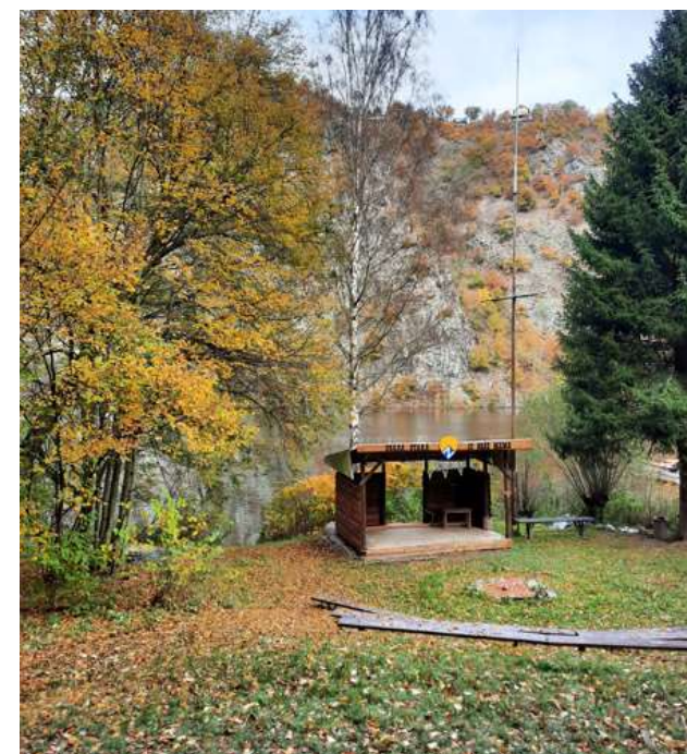
Jedním z nejslavnějších obyvatel Ztracenky se stal tramský písničkář Jarka Mottl