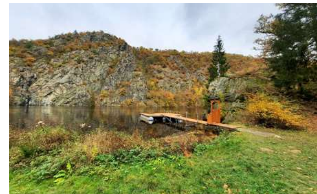
Ztracenka patřila mezi naše nejznámější tramské osady, v roce 1944 však byla zatopena vodami štěchovické přehrady

Na dlouhé cestě čekaly plavce všelijaké nástrahy, jeden úsek však předčil jiné partie řeky snad po všech stránkách. Vltava se tady