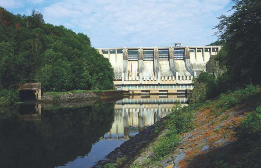
Voroplavbu na Vltavě definitivně ukončilo budování Vltavské kaskády