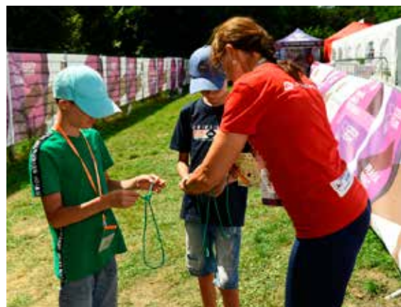
Olympijský festival v Praze: Kontrola „Uzly“ na mini turistickém závodu

provod, který jim objasnil, o co jde a v čem závod spočívá. V cíli zájemci obdrželi pamětní list, odznak turistického závodu, píšťalku s logem a háčkované hračky. Závod absolvoval i olympijský vítěz z Londýna 2012 David Svoboda, jenž byl skutečně vzorným posluchačem a úspěšným závodníkem. V soutěži „Krásy vlasti“ turisté poznávali české památky (Říp, Pravčickou bránu, Trosky a Karlštejn) a jubilejní účastníci získali obrazovou publikaci o České republice. Expozice „Od Náprstka po současnost“ přibližovala na osmi panelech historii KČT od založení spolku až do dnešních dní (tedy od roku 1888 přes spoluzaložení ČOV, chaty KČT až po Asociaci TOM, hry, výlety a turistický závod). V části „Turistická značka“ bylo možné se seznámit s historií i současností značení a namalovat si svoji turistickou značku. Připravena byla také celá řada her a kvízů. Výzva „Vystup na svůj vrchol“