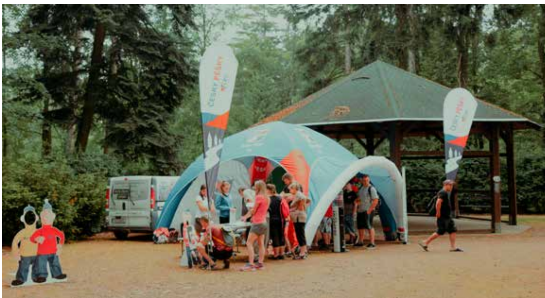
Projekt Česky pěšky je novinkou letošního roku