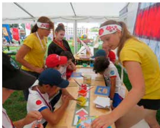
Olympijský festival v Praze: Malí značkaři se zacvičují pod dohledem japonských gejš