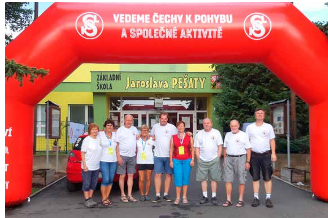
Pořadatelský tým XVII. Letního turistického srazu Giacoma Casanovy v Duchcově

rozhlednu na Vlčí hoře (891 m). V Českém středohoří jsme zdolali nejvyšší horu Milešovku (837 m) a vrch Lovoš (570 m). Zájemci se mohli rozhlédnout z věže hradu Kostomlaty (Sukoslav, 570 m) anebo z vyhlídkové věže kostela Církve československé husitské v Duchcově, která dosahuje výšky 42 m, případně se projet na lodičkách po rybníku Barbora, jenž se nachází hned vedle kostela. A právě na pódiu u tohoto rybníka byl ve středu od 18 hodin slavnostně zahájen XVII. Letní turistický sraz Giacoma Casanovy. Moderátorem se stal samotný Giacomo Casanova, který přivítal všechny přítomné turisty. Se svým projevem vystoupil náměstek hejtmana Ústeckého kraje PhDr. Zdeněk Matouš, starosta města Duchcova Mgr. Zbyněk Šimbera, místopředsedové KČT Ing. Ivan Press