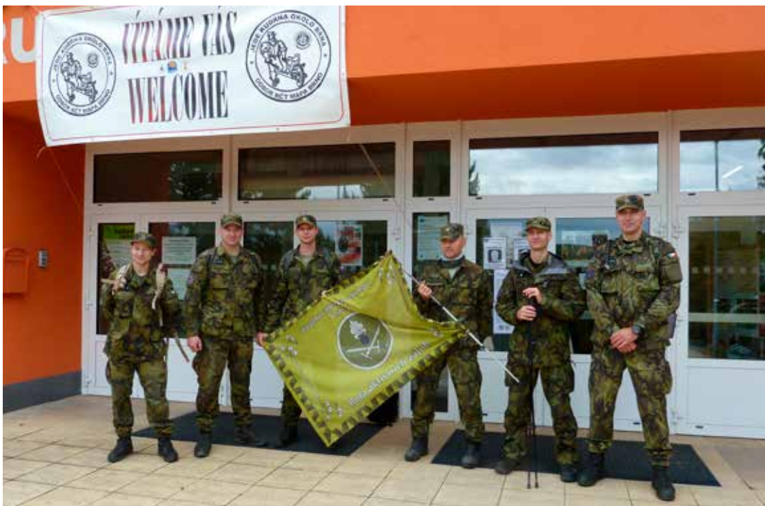
Pochodů IML se pravidelně účastní několik (nejen domácích) vojenských jednotek, na snímku jednotka aktivních záloh z Ostravy