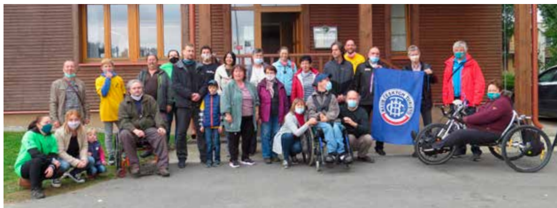
Účastníci slavnostního otevření vozíčkářské trasy před Saloonem Zlatá podkova