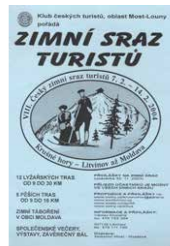
Plakát VIII. Českého zimního srazu 2004 Litvínov-Moldava, motiv (stranově převrácený) byl použit z vedlejší historické fotografie