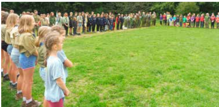
Zahájení srazu