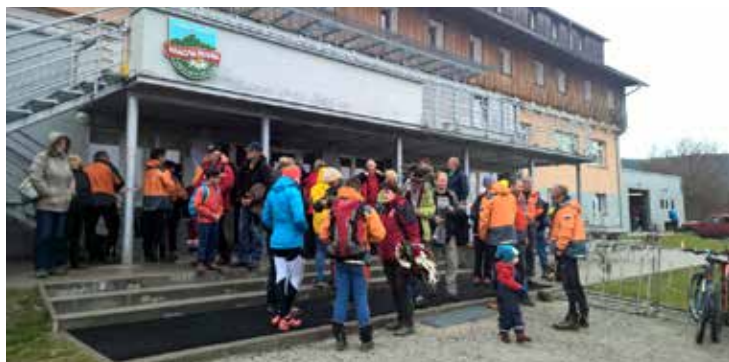
Shromáždění turistů před odhalením pamětní desky k 90. výročí chaty Králova Studňa

desky k 90. výročí postavení chaty, zahájila v 11:00 hodin mše za oběti hor, a to za přítomnosti více než 50 účastníků. Oběti Velké Fatry připomněli pořadatelé a jménem KČT zde promluvil místopředseda Jiří Homolka. Následně bylo připomenuto, že masiv Krížné patřil již ve 20. letech