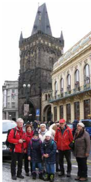
Skupina jihlavských turistů na trase

založení klubu cesta vedla přes místa, která jsou spojena s historií KČT. Procházeli jsme tak kolem všech historických sekretariátů KČT (s výjimkou sekretariátu na Strahovském stadionu a na Lužnicích), dále kolem budovy bývalé Měšťanské besedy, kde se konala dne 11. června 1888 ustavující valná hromada klubu, a i kolem bývalého domu KČT ve Školské ulici. Nevynechali jsme však ani Náprstkovo muzeum, kde se konala přípravná jednání k založení klubu a kde odpočívá první předseda klubu Vojta Náprstek, a přes Petřín a Pohořelec jsme dorazili až do cíle v restauraci u Muzea městské hromadné dopravy v Praze. Tato trasa ovšem reflektovala i oslavy 100 let od vzniku Československé republiky, a tak jsme navštívili i místa spojená právě se vznikem a trváním samostatného československého státu. Již nyní