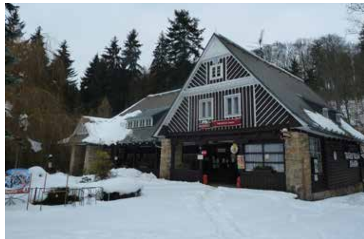
Chata KČT na Prachově