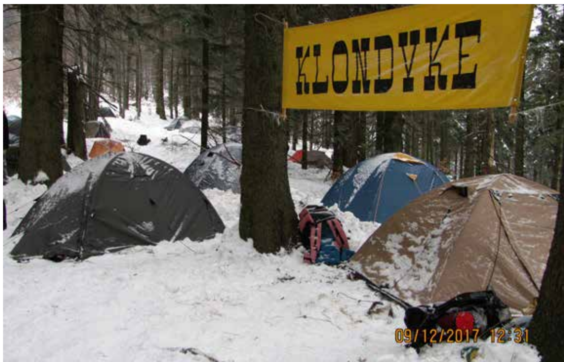
51. ročník Zimního táboření Klondyke

přesunout dlouhé tyče pro stavbu typí. V dalších ročnících to, věřím, kamarádi z Havířova stačí. V roce 2017 totiž zůstali pod Kalužným, u chaty na Slavíči, a chyběli nám. I tentokrát navíc bylo o čem mluvit. Vzpomínalo se na předchozí ročníky - na deset let na Smrku, Travném, Ropici, Slavíči a Kalužném - a hovořilo se i o nových možnostech pro pořádání zimních táborů. A nejen to.