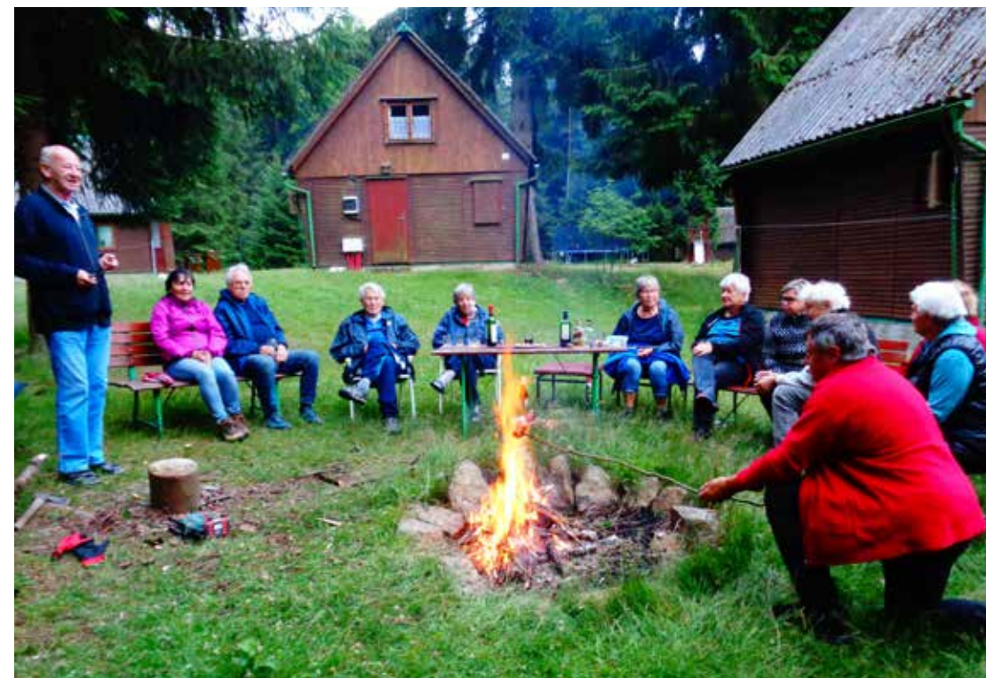
Večer v kempu na Osice, Česká Kanada