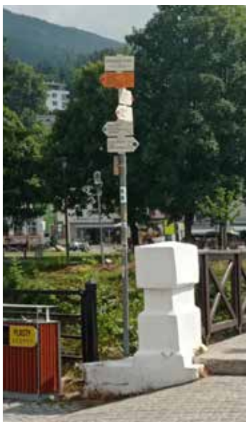
Hlavní směrovník „Špindlerův Mlýn, most“ - pohled k Bílému mostu

Dosavadní umístění centrálního turistického směrovníku v parčíku před poštou ve Špindlerově Mlýně přestalo vyhovovat současným potřebám jak turistů, tak hustému silničnímu provozu v jeho těsné blízkosti. Centrální směrovník byl proto rozdělen na tři části, které se nacházejí na vhodných místech. Základ nové turistické orientace představuje nový hlavní směrovník turistického uzlu Špindlerův Mlýn, který je nazván „Špindlerův Mlýn, most“ a který najdeme v bezprostřední blízkosti známého objektu Bílý most. Toto místo je výhodné jak pro turistu, který do Špindlerova Mlýna dorazí veřejnou dopravou, tak pro toho, kdo přijede vlastním autem a zaparkuje na centrálním parkovišti (vedle autobusového terminálu). Jeho umístění jistě ocení také turisté, kteří do Špindlerova Mlýna dorazí pěšky od Benecka (Jilemnice), z Horních Míseček