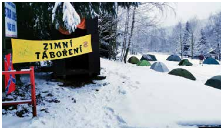
Z jubilejního 60. ročníku zimního stanování Akce Klíč