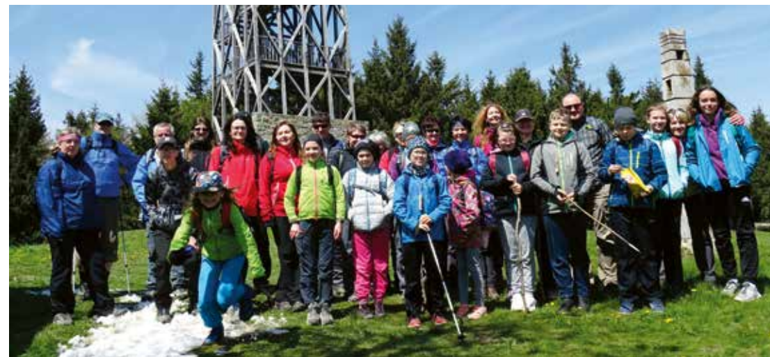
Turisté z Uherského Ostrohu na Velkém Lopeníku, rok 2019