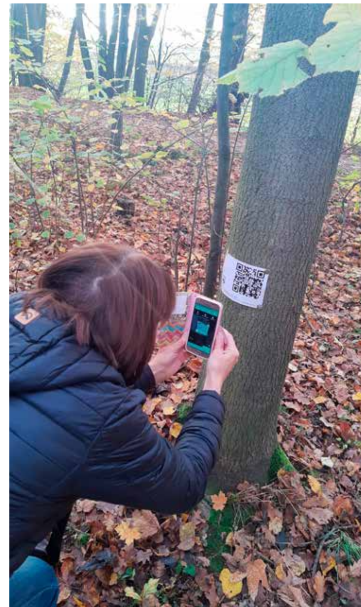
Tomíci z Opavy hledali QR kódy ve Slavkovském lesíku