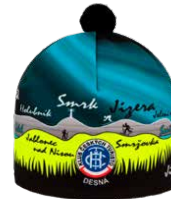
Nabídka turistické čepice od firmy Rituall z Frenštátu pod Radhoštěm