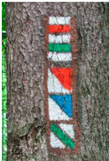
V minulém roce bylo obnoveno více než 15 500 km pěších turistických značených tras (foto: Pavel Přílepek)

V rámci plánu pravidelné obnovy turistických značených tras (TZT) bylo v roce 2020 obnoveno více než 15 500 km z celkové délky 43 578 km pěších stezek. Plán byl tak překročen o téměř 500 km. Největší podíl na nárůstu kilometrů obnovy značených tras je způsoben nutností obnovit značení na trasách v oblastech zasažených kůrovcovou kalamitou nebo na trasách jinak poškozených různými, většinou přírodními vlivy. Na všech těchto pracích se v Česku podílelo více než 1800 značkařů. Kromě turistických značek je na našich stezkách vyvěšeno 68 986 směrovek a tabulek, instalováno 3 653 směrovníků a 1 485 turistických vývěsních map ve stojanech nebo v rámech. Kromě pěších tras je vyznačeno dalších 511 km lyžařskými značkami. V roce 2020