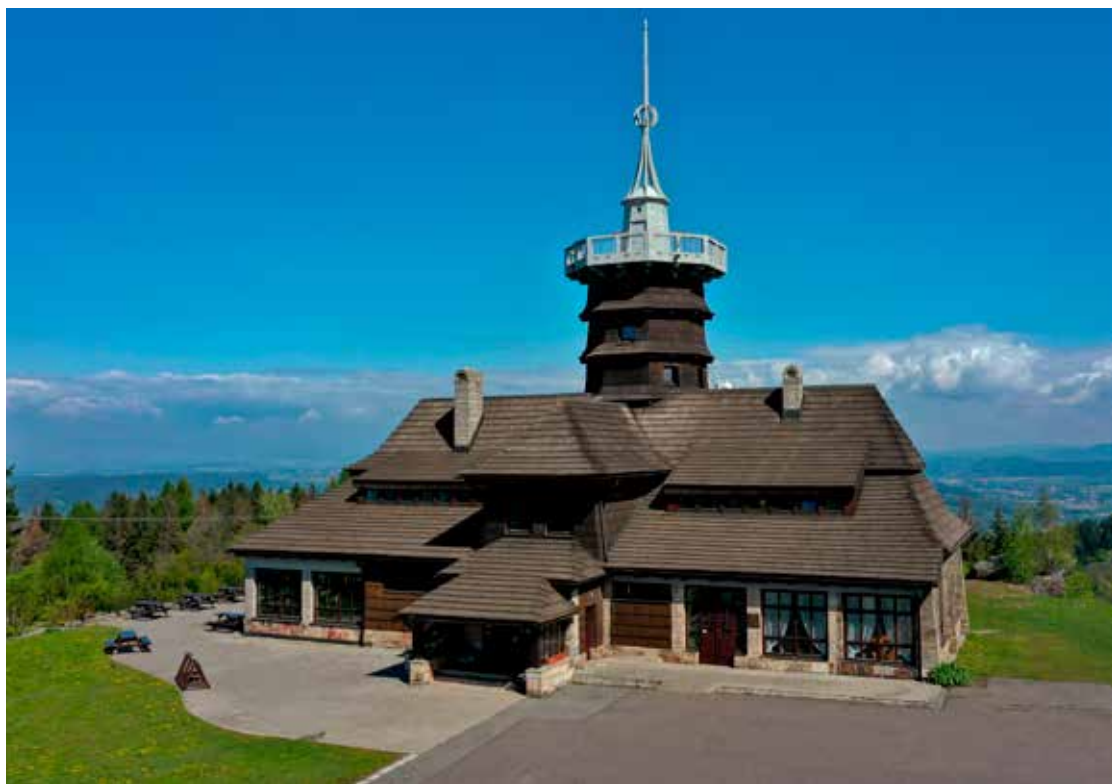
Do programu „Na kole po chatách KČT“ je zapojena také Jiráskova chata na Dobrošově