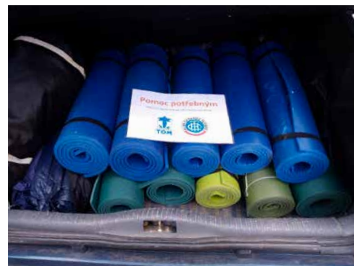
Dar KČT Kralupy nad Vltavou pro vybudování stanového městečka na Císařské louce (foto: Zdeněk Vejrosta)

Zdeněk Vejrosta, KČT Kralupy nad Vltavou