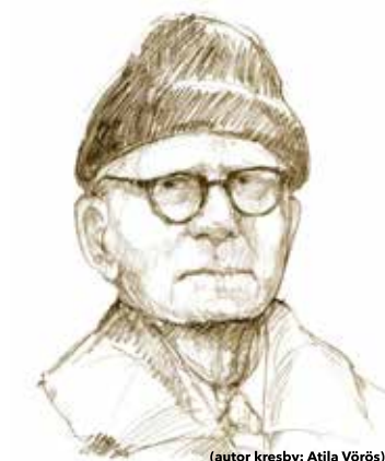
(autor kresby: Atíla Vörös)

Narodil se dne 5. února 1898 v saském Krippenu. V roce 1928 se stal jedním ze zakládajících