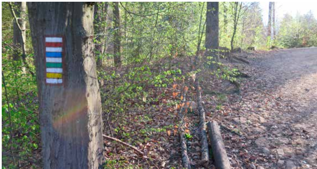
Rada značení KČT se skládá ze tří samostatných sekcí: sekce turistického značení, sekce cykloznačení a sekce moderních pěších tras