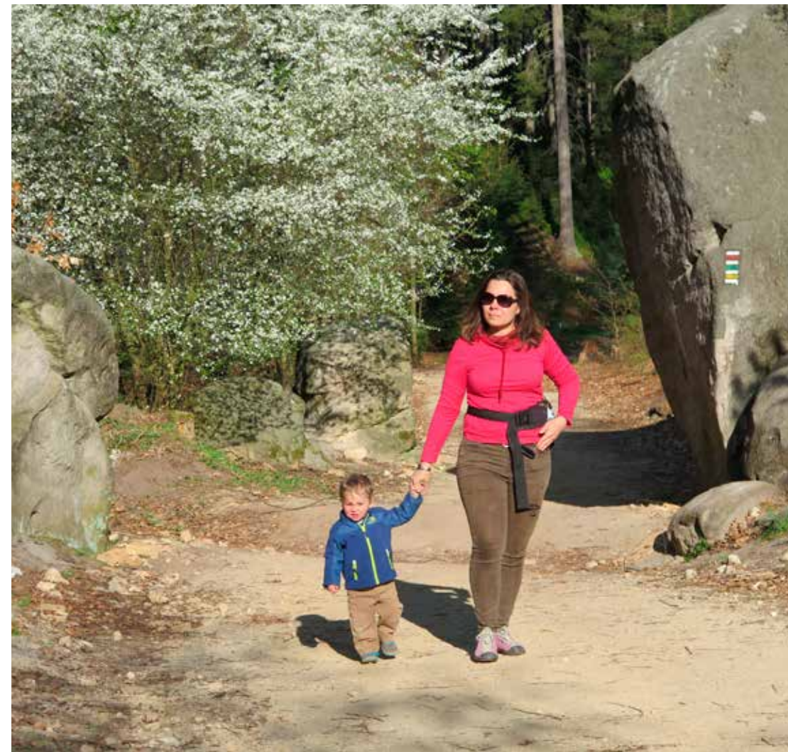
Délka pěších turistických značených tras v ČR k 31. prosinci 2020 činila 43 590,4 km

Ing. Mojmir Nováček, zástupce generálního sekretáře KČT