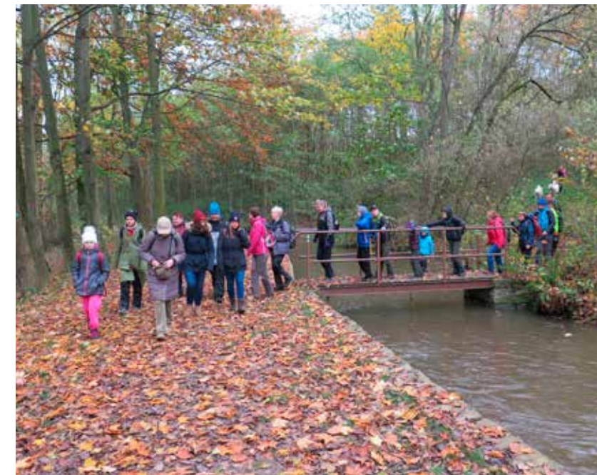
Fotografie z nově založené fotobanky budou sloužit k nekomerční prezentaci aktivit KČT

akcí. Fotobanka bude přístupná členům KČT, kteří požádají o přístup, jenž bude žadateli udělen na určité období. Vkládání foto-