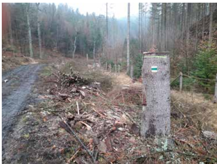
Typický obrázek mnoha smrkových lesů v současnosti

Turistické značení je v současnosti v některých místech zasažených kůrovcovou kalamitou méně spolehlivé. Majitelé a správci lesů, především smrkových monokultur, intenzivně bojují s kůrovcem. Nejúčinnější obranou však je napadené porosty odstranit. Těžba dřeva napadeného kůrovcem se samozřejmě nevyhýbá ani lesům, kterými vedou turistické značené trasy. Za oběť padlo a ještě padne i mnoho stromů, na kterých jsou umístěny turistické značky. Značkaři se snaží situaci sledovat