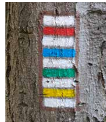
V Česku na konci roku 2020 existovalo 43 590,4 km pěších turistických značených tras a 39 106,5 km cyklotras