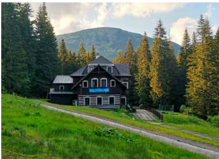
Chata Pod Studničnou

Projekt Po chatách KČT letos vstupuje do druhého roku své existence. V loňském roce ho využila necelá stovka turistů, kteří pěšky či na kole navštívili chaty KČT a využili balíček služeb, které pro ně KČT připravil. Projekt Po chatách KČT umožňuje zájemcům objednat si z jednoho místa tzv. turistický balíček, který obsahuje zajištění ubytování a stravování na chatách KČT s možností cestovat „nalehko“. Projekt je rozdělen na dva programy. První z nich nese název „Pěšky po chatách KČT“ a jsou do něj zařazeny Vosecká bouda, Brádrerovy boudy, turistické chaty Výrovka a Pod Studničnou. Druhý program se jmenuje „Na kole po chatách KČT“ a nabízí turistické chaty Pláně pod Ještědem, Prachov, Voseckou boudu, chatu Pod Studničnou, Jiráskovu chatu na Dobrošově a chatu Na Čiháku. Trasu si každý může zvolit podle své výkonnosti. Projekt umožňuje i zařazení tzv. odpočinkových dnů, a to pro případ, kdy se rozhodnete zůstat na jedné chatě více nocí. Stejně tak lze některou chatu vynechat, anebo absolvovat jen určitou část cesty a zbytek si nechat napříště. Všechny tyto alternativy si můžete zvolit v rezervačním formuláři. Cena balíčku je samozřejmě nižší než součet jednotlivých cen ubytování na vámi zvolených chatách. Z celkové částky za nocleh se dále členům KČT odečítá sleva na chatách, kterou mohou čerpat dle nabídky KČT. A jak to vlastně celé funguje? Po vyplnění rezervačního formuláře nejdříve ověříme, zdali je ve vámi požadovaný termín volně