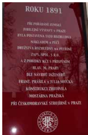
Pamětní deska na Petřinské rozhledně