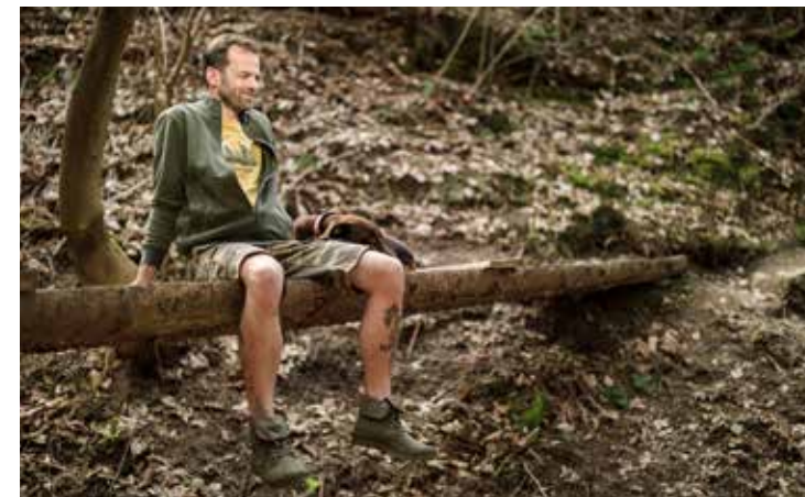
Odolné maskáče: cargo kráťasy Trooper

razítko, které otisknete do soutěžní karty. Chodit na výlety můžete kdykoliv, ale soutěž trvá jen v létě, konkrétně v termínu od 1. července do 31. srpna 2021. Až budete mít navštívena alespoň tři místa a otisknuta tři razítka, pak se s kartou můžete vydat na jednu z 27 kamenných prodejen Bushmann po celé republice. Zde vám odměnou bude speciální Absolventská turistická vizitka. Každý výletník, který předloží soutěžní arch, rovnou padá do osudí pro losování o 100 hlavních cen, mezi které patří víkendový pobyt v tradičních horských chatách KČT pod Ještědem, na Šumavě či v Krkonoších, outdoorové suvenýry, nákupní vouchery do sítě prodejen Bushman či prémiová vína Znovín ze znojenské oblasti. Popis výletních tras naleznete na www.kct.cz , www.bushman.cz nebo na podcastu Youradio.cz „Výlety s KČT“.