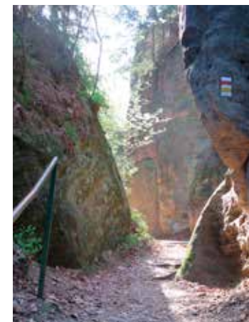
Sekce moderních pěších tras pracovala v roce 2020 především na trase Modré hřebenovky přes Krušné hory a České Švýcarsko

v ČR dosáhla 39 106,5 km, z nichž je 9 420,8 km dálkových a 29 685,7 km regionálních a místních. Sekce má v jedenácti krajích a v 68 značkářských obvodech své zástupce. Jejich hlavním úkolem je zajistit s pomocí dalších vyškolených cykloznačkářů kontrolu stavu značení cyklotras svého regionu a nahlásit všechny nedostatky předsedovi sekce, případně své oblasti KČT, kteří zajišťují jejich doznačení příslušnými firmami. Pouze v Libereckém a Jihočeském kraji