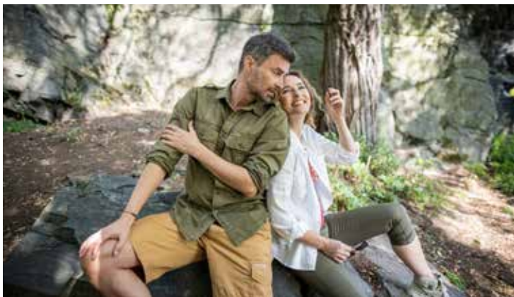
Lehké a funkční: kraťasy Breson II

Je libo pravé „kapsáče“, ve kterých splynete s přírodou? Cargo kraťasy Trooper jsou ze stoprocentní bavlny, v keprové tkanině je použita efektní, místy zesílená nit, takže má neklidnou strukturu, navíc s drobným vzorem rybí kosti. Efektní „maskáčování“ je vytvořené kombinací pigmentového tisku a reaktivního barvení.