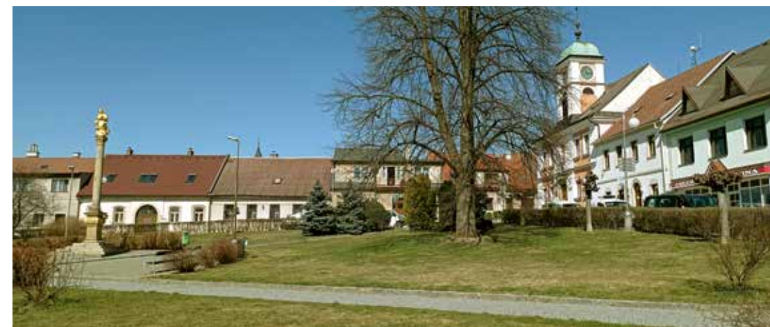
Náměstí v Solnici s mariánským sloupem