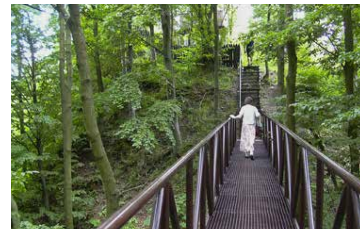
Torzo skuhrovského hradu s rozhlednou

obce nepochybně osloví každého automobilistu. Vždyť právě zde vyrostl velký závod, v němž se stále ještě rozšiřuje výroba škodovek. Ale za podívání stojí i zámek s rozsáhlým parkem. V Kvasinách se původně široké údolí Bělé začíná pozvolna zužovat, a jak se blížíme k horám, rostou i kopce, které toto údolí lemují. Jen opravdu malý kousek cesty nás teď dělí od Skuhrova nad Bélou. Tady už převýšení okolních kopců nad řekou dosahuje několika desítek metrů a ti méně zdatní trochu zafuní, než na ně vyjdou. Ale cesta je pohodlná a její cíl stojí za to. Přivítají vás totiž pozůstatky jednoho z nejstarších podorlických hradů. Najdete je hned vedle kostela, který je zasvěcen sv. Jakubu Většimu a byl vystavěn v 18. století v barokním stylu právě z kamenů rozpadlé hradní stavby. Ta je samozřejmě mnohem starší, pochází ze století třináctého a z jejího vrcholku je nádherný rozhled na hluboké skuhrovské údolí. Když se vám podaří zavítat sem v letních měsících, můžete mít štěstí a zhlédnout řezbářské symposium Proměny dřeva, na němž před vašimi očima