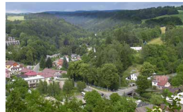
Pohled z bývalého skuhrovského hradu