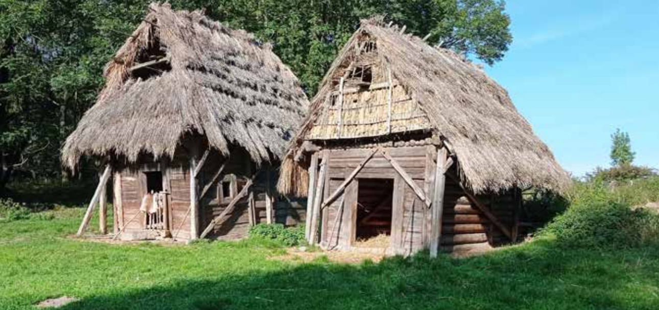
Středověké vesnické chalupy