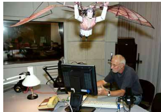
Jako častý host Českého rozhlasu

Jelikož jsem geobotanik a ekolog, zajímá mě celý biotop. V rostlinné sociologii je známý termín konsocie, což je společenství objektu. Představte si osamocené dub, pod